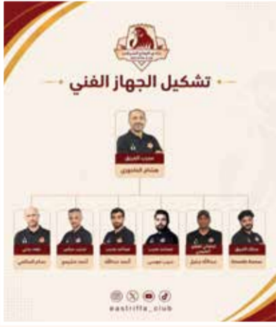
○ الجهاز الفني.