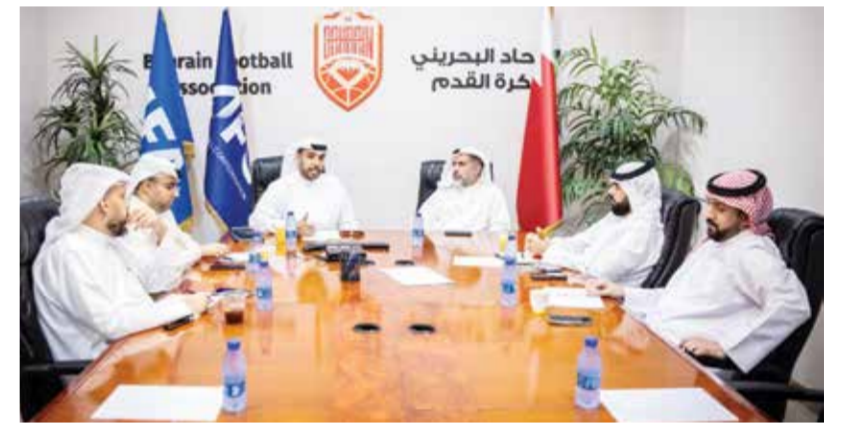
○ جانب من الاجتماع.