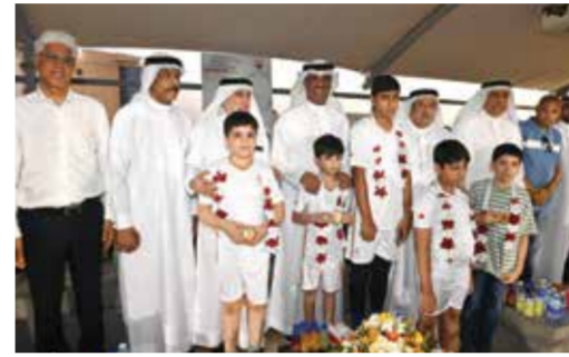
○ جانب من الحضور