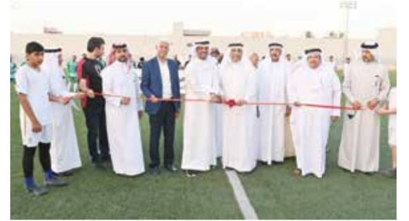
○ افتتاح البطولة