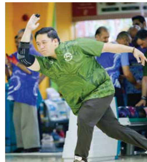
○ جانب من المنافسات.

وتنتج الأنتظار إلى منافسات الجولة السادسة المقبلة التي ينتظر أن تشهد مزيداً من الإثارة والمنافسة، وخاصة في ظل تقارب المستويات بين فرق المقدمة وسعيها لتعزيز حظوظها في المنافسة على لقب الدوري العام للبولينج، إذ ستقام منافساتها يوم الأحد المقبل عند الساعة السادسة والنصف مساءً بصالة أرض المرح ان سيلتيق مدينة عيسى مع الاتفاق، والبسيتين مع الرفاع، وام الحصم مع البحرين، والحالة مع سند.