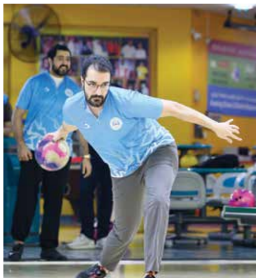
○ جانب من المنافسات.