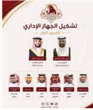
○ الجهاز الإداري.