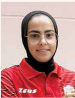
○ إسماء السرطان.

لدى الفتيات من مواليد الأعوام 2009 وحتى 2014، وصقل مهارتهن وفق أسس تدريبية حديثة تضمن بناء جيل رياضي متميز قادر على تمثيل المنتخبات الوطنية مستقبلاً.