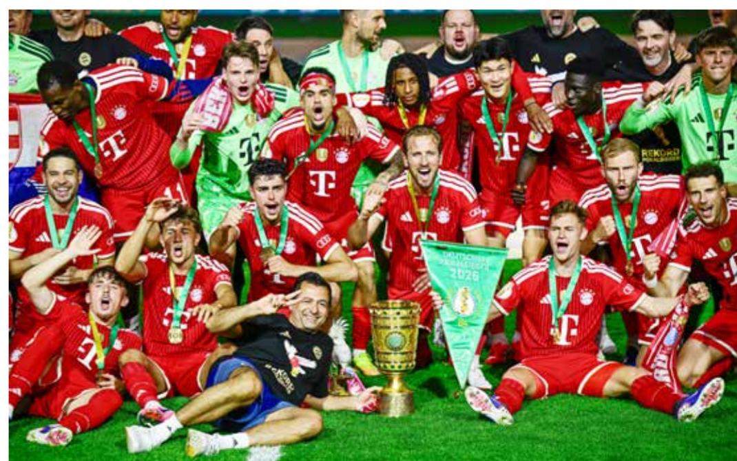
○ من تتويج بايرن باللقب. (أ ف ب)

برلين - (أ ف ب): قاد المهاجم الدولي الإنكليزي هاري كاين فريقه بايرن ميونيخ إلى استعادة لقب مسابقة كأس ألمانيا لكرة القدم للمرة الأولى منذ 2020، بتسجيله «هاتريك» الفوز على شتوتغارت بطل النسخة الماضية 0-3 أمس السبت في النهائي. وأكد بايرن هيمنته الكاملة على الكرة الألمانية من خلال تتويجه بالثلاثية المحلية بعد حسمه لقب الدوري للمرة الـ13 خلال المواسم الـ14 الأخيرة. ورفع كاين رصيده إلى 61 هدفاً في مختلف المسابقات هذا الموسم، ليواصل تقديم واحد من أفضل مواسمه التهديفية على الإطلاق، على بعد أقل من 20 يوماً من انطلاق كأس العالم. وأنهى العملاق البافاري بهذا التتويج صياما دام منذ عام 2020 عن إحراز لقب الكأس، وهو الأطول له خلال القرن الحالي، رافعا عدد ألقابه في المسابقة إلى 21 بفارق 14 عن أقرب ملاحقيه فيردير بريمن. وجاء الهدف الأول لقائد المنتخب الإنكليزي بعد تمريرة حاسمة من الفرنسي ميكائيل أوليسيه الذي رفع بدوره عدد تمريراته الحاسمة هذا الموسم إلى 30 في مختلف المسابقات (55). كما أسهم الكولومبي لويس دياس في صناعة الهدف الثاني (80)، قبل أن يحتتم كاين الثلاثية من ركلة جزاء في الوقت بدلا من الضائع (90+2). وأكد هذا التتويج مجددا الهيمنة المطلقة لبايرن على الكرة الألمانية، بعدما حقق الثلاثية المحلية للمرة الرابعة عشرة في تاريخه، وهو إنجاز لم ينجح أي نادٍ ألماني آخر في تحقيقه أكثر من مرة واحدة.