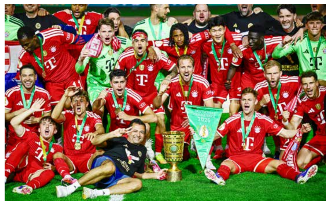
○ من تتويج بايرن باللقب. (أ ف ب)

برلين - (أ ف ب): قاد المهاجم الدولي الإنكليزي هاري كاين فريقه بايرن ميونيخ إلى استعادة لقب مسابقة كأس ألمانيا لكرة القدم للمرة الأولى منذ 2020، بتسجيله «هاتريك» الفوز على شتوتغارت بطل النسخة الماضية 0-3 أمس السبت في النهائي. وأكد بايرن هيمنته الكاملة على الكرة الألمانية من خلال تتويجه بالثلاثية المحلية بعد حسمه لقب الدوري للمرة الـ13 خلال المواسم الـ14 الأخيرة. ورفع كاين رصيده إلى 61 هدفاً في مختلف المسابقات هذا الموسم، ليواصل تقديم واحد من أفضل مواسمه التهديفية على الإطلاق، على بعد أقل من 20 يوماً من انطلاق كأس العالم. وأنهى العملاق البافاري بهذا التتويج صياماً دام منذ عام 2020 عن إحراز لقب الكأس، وهو الأطول له خلال القرن الحالي، رافعا عدد ألقابه في المسابقة إلى 21 بفارق 14 عن أقرب ملاحقيه فيردير بريمن. وجاء الهدف الأول لقائد المنتخب الإنكليزي بعد تمريرة حاسمة من الفرنسي ميكائيل أوليسيه الذي رفع بدوره عدد تمريراته الحاسمة هذا الموسم إلى 30 في مختلف المسابقات (55). كما أسهم الكولومبي لويس دياس في صناعة الهدف الثاني (80)، قبل أن يحتتم كاين الثلاثية من ركلة جزاء في الوقت بدلا من الضائع (90+2). وأكد هذا التتويج مجددا الهيمنة المطلقة لبايرن على الكرة الألمانية، بعدما حقق الثنائية المحلية للمرة الرابعة عشرة في تاريخه، وهو إنجاز لم ينجح أي نادٍ ألماني آخر في تحقيقه أكثر من مرة واحدة.