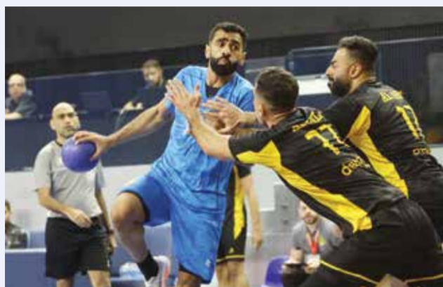
○ لقطة من منافسات الدور التمهيدي.