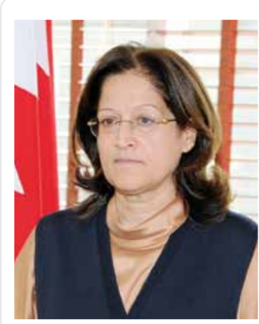
○ بقلم: سميرة بن رجب

تقوم فلسفة الكينتسوغي على مبدأين جوهريين في الثقافة اليابانية: 1- الوابي سابي (Wabi-sabi): أي تقدير الجمال في النقص وعدم الكمال والزوال... فبدلاً من إخفاء الشقوق يتم إبرازها وتزيينها، لتصبح جزءاً من تاريخ القطعة وهويتها. 2- الموجو (Mujo)، وهو مفهوم بوذي