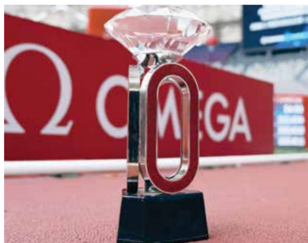
○ الدرع الماسي.

الدوحة - (د ب أ): تؤكد رسميا إقامة جولة الدوحة للدوري الماسي لألعاب القوى يوم 19 يونيو المقبل، بعد قرار تأجيلها مدة ستة أسابيع، لتعود العاصمة القطرية الدوحة مجددا لاستضافة نخبة نجوم ألعاب القوى العالمية ضمن إحدى أبرز محطات سلسلة الدوري الماسي. وأعلن الاتحاد القطري لألعاب القوى طرح تذاكر الحدث عبر منصة «كيو تيكيت»، إبانها بانطلاق العد التنافلي للملتقى المرتقب، فيما نشر عبر حسابه الرسمي صورة للبطال الأولمبي والعالم القبطي معتز برشم، مرفقة بعبارة: «الوعد 19 يونيو 2026»، في إشارة إلى عودة الصقر الذهبي للمشاركة أمام الجماهير القطرية على مضمار وميدان استاد سحيم بن حمد بنادي قطر.