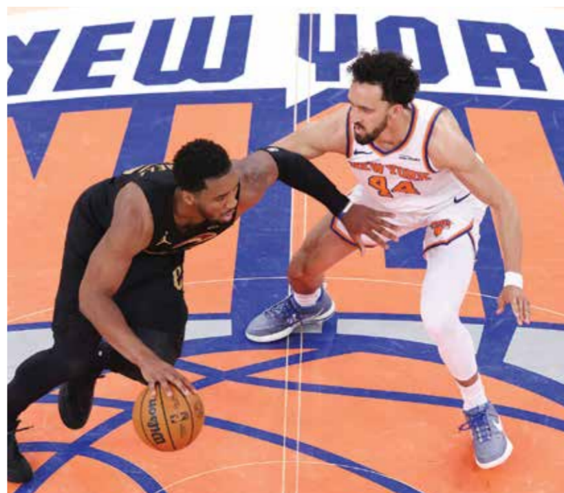
○ من مباراة نيكس وكافاليرز

وتابع «إنهم يلعبون كرة سلة رائعة ووجدنا طريقة للفوز».