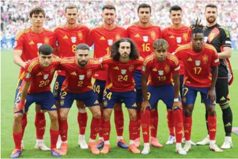
○ منتخب إسبانيا

مريد - (أ ف ب): يتوجه ملك إسبانيا فيليب السادس إلى المكسيك لحضور مباراة منتخب بلاده ضد الأوروغواي في 26 حزيران في غواداخارا، في الجولة الفائزة الأخيرة من منافسات المجموعة الثامنة ضمن مونديال 2026 لكرة القدم، بحسب ما أعلنت مصادر في الديوان الملكي الإسباني أمس الاثنين، في مؤشر جديد على تحسن العلاقات بين مدريد ومكسيكو.