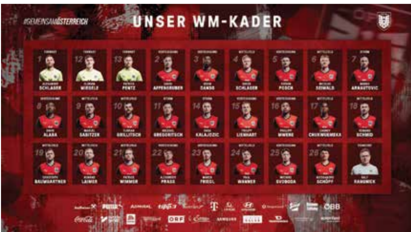
○ قائمة النمسا.

برلين - (د ب أ): أعلن الألماني رالف رانجنيك، المدير الفني للمنتخب النمساوي القائمة النهائية للفريق الذي سيشارك في كأس العالم لكرة القدم للمرة الأولى منذ عام 1998، والتي تضمنت 14 لاعبا من الدوري الألماني.