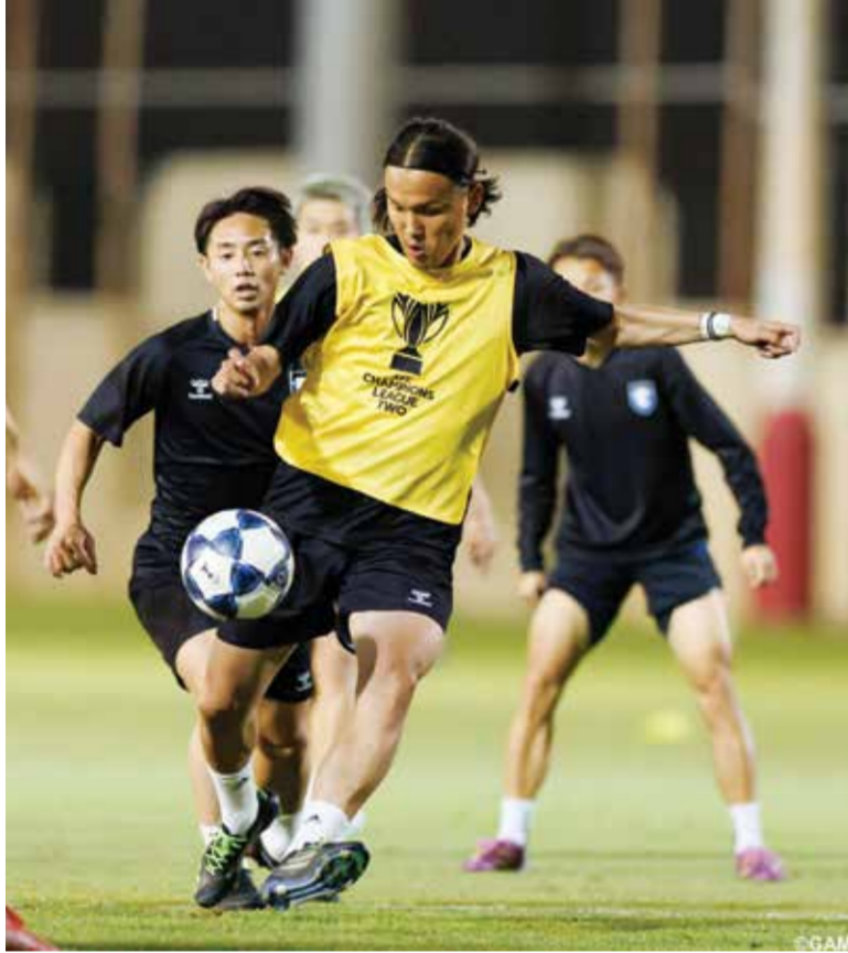
○ تحضيرات غامبا أوساكا

ولم تحصل القائمة التي أعلن عنها مدرب المنتخب الياباني هاجيمي مورياسو لمونديال أوساكا الغائبي عن العرس العالمي. وقال المهاجم غاكو ناواتا عبر موقع النادي «أنا متحمس جدا وأتطلع بشغف إلى النهائي».