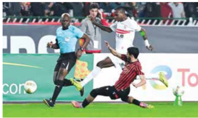
○ من مباراة الذهاب بين الزمالك واتحاد الجزائر.