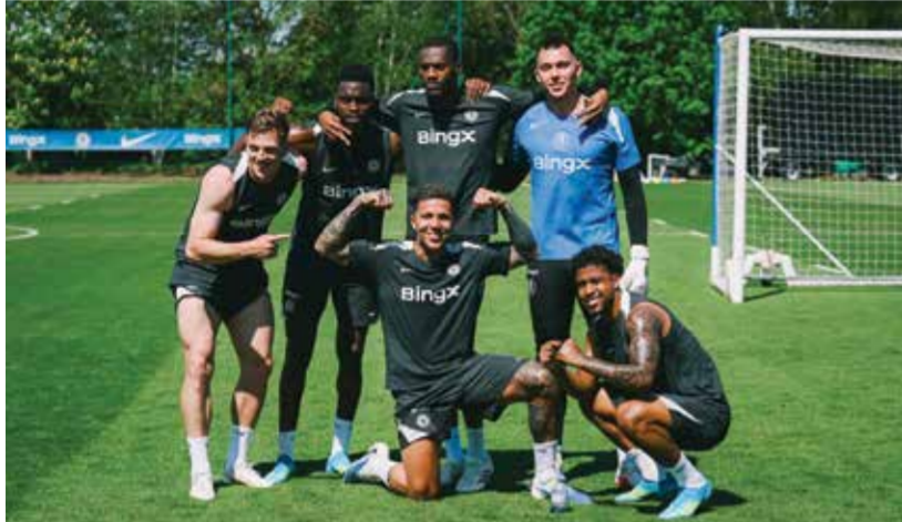
○ لاعبو تشلسي