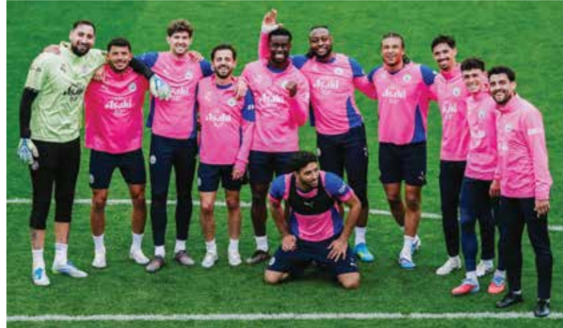
○ لاعبو سيتي