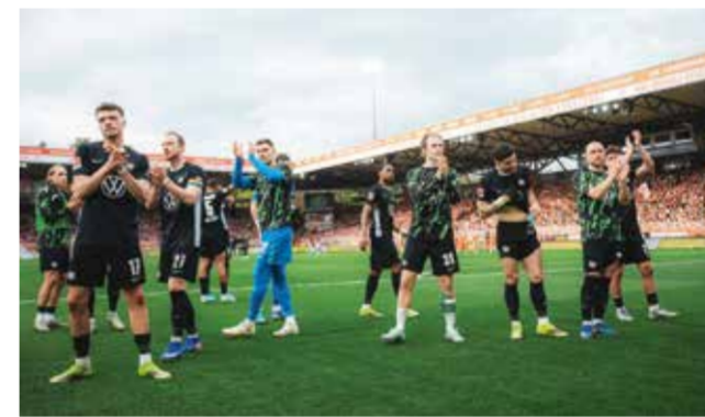
○ لاعبو فولفسبورغ

فولفسبورغ قد ينهي الموسم في المركز السادس عشر حتى في حال التعادل، لكن ذلك مشروط بعدم فوز هايدنهايم. وفي أعلى الترتيب، لا يزال مقعد واحد في دوري أبطال أوروبا متاحا بعدما ضمن كل من بايرن ميونخ البطل وبوروسيا دورتموند ولايبزيغ التأهل. ويتساوى شتوتغارت صاحب المركز الرابع مع هوفنهايم الخامس في عدد النقاط، لكنه