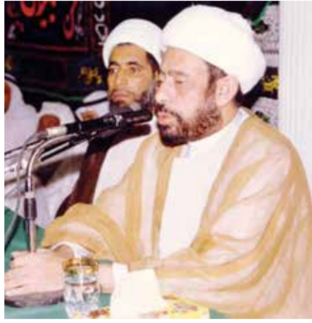
○ المرحوم الشيخ سليمان المدني.

تتفي عائلة العلامة المرحوم الشيخ سليمان المدني نفياً قاطعاً، وتستنكر بأشد العبارات، ما تداولته بعض حسابات التواصل الاجتماعي المغرضة من بيان منسوب زوراً للعائلة، في سلوك شائن يظهر إفلاس أصحاب تلك الأجندات الهدامة، ويغفلهم من خطاب وزير الداخلية الموقر وما تضمنته من إشادة بالموافق الصادقة والناصحة لشيخنا رحمته الله، وما حظي به ذلك من ترحيب من أبناء الوطن المخلصين كافة. ونؤكد التزامنا بالنهج الواضح الذي يسار عليه رحمه الله، وتأييدنا لكل ما يدعم أمن الوطن واستقراره وسلامته أبنائه في ظل قيادة جلالة الملك المعظم.