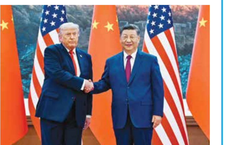
○ لقاء ترامب وشي في بكين.

بكين - (الوكالات): أعلن البيت الأبيض أن الرئيس الأمريكي دونالد ترامب ونظيره الصيني شي جينبينغ اتفقا خلال لقائهما في بكين أمس على ضرورة بقاء مضيق هرمز مفتوحاً. وأشارت الرئاسة الأمريكية إلى أن «الجانبيين اتفقا على ضرورة إبقاء مضيق هرمز مفتوحاً لدعم التدفق الحر لمنتجات الطاقة». وأكدت الرئاسة الأمريكية أن شي عبّر عن معارضة الصين لـ«عسكرة» مضيق هرمز وفرض أي رسوم عبور فيه. ودعت الصين باستمرار إلى إتاحة حرية الملاحة في مضيق هرمز الذي يمر عبره نسبة كبيرة من وارداتها النفطية. من جانبه، قال ترامب إن نظيره الصيني عرض المساعدة في إعادة فتح المضيق وتعهده بعدم إرسال معدات عسكرية لمساعدة إيران في حربها مع الولايات المتحدة وإسرائيل. وصرح ترامب لبرنامج «هانيتي» على قناة