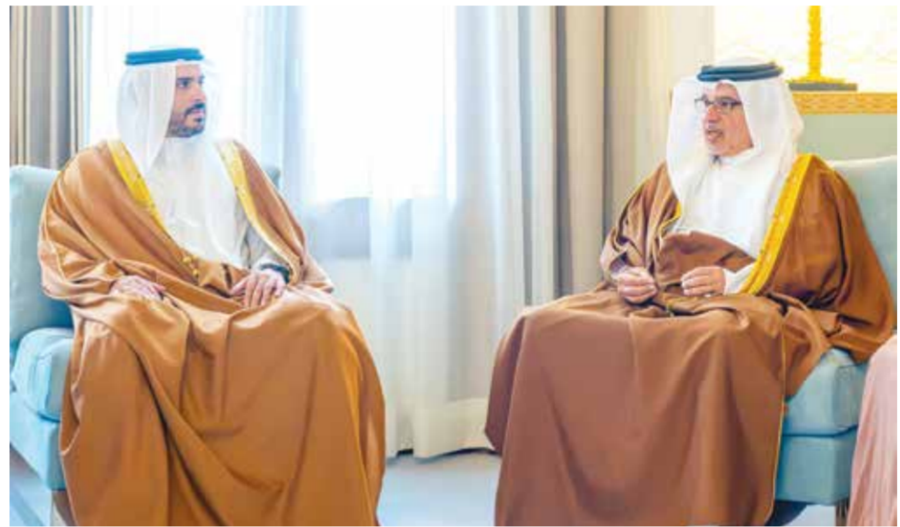
○ سمو ولي العهد رئيس الوزراء خلال استقباله سمو الشيخ محمد بن سلمان بن حمد.

بحلول عام 2035، كذلك أشاد سموه بحصول مملكة البحرين على جائزة خليفة الدولية لنخيل التمر والابتكار الزراعي، وجائزة التميز الحكومي العربي، إلى جانب تكريم أربع قرى بحرينية ضمن مبادرة (الفاو) لتكريم القرى الزراعية. من جانبه، أشاد سمو الشيخ محمد بن سلمان بن حمد آل خليفة بما تحظى به الخطط والبرامج البيئية والزراعية من رعاية ملكية سامية ودعم كريم من حضرة صاحب الجلالة الملك حمد بن عيسى آل خليفة ولي العهد رئيس مجلس الوزراء، وتولي أهمية بالغة لتوجيهات جلالتة الحكيمة من مركز أساسى لمسيرة التنمية المستدامة والحفاظ على الموارد الطبيعية وتعزيز الأمن البيئي في مملكة البحرين.