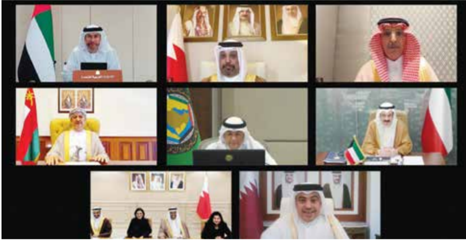
○ وزير المالية خلال ترؤسه اجتماع لجنة التعاون المالي والاقتصادي.

ولي العهد رئيس الوزراء: تبني مبادرات الحفاظ على البيئة وصون الموارد الطبيعية