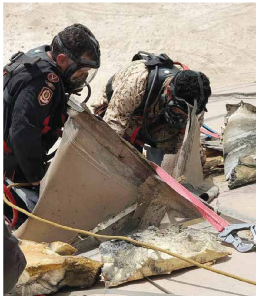
○ خلال أعمال الصيانة والسيطرة على الأضرار.

أعلنت وزارة الداخلية الانتهاء من جميع أعمال الصيانة والسيطرة على الأضرار التي لحقت بمنشأة شركة الخليج للبتروكيماويات، التي تعرضت لاستهداف مباشر من مسيرة إيرانية بتاريخ 5 أبريل 2026 في إطار العدوان الإيراني الآثم على الأرواح والممتلكات ومرافق البنية التحتية والمنشآت الصناعية والنظمية، والتي تعد من جرائم الحرب، التي يؤتمنها القانون الدولي الإنساني وترفضها المواثيق والأعراف الدولية. وأشارت وزارة الداخلية إلى استكمال عودة المواطنين من أهالي المنطقة إلى منازلهم، بعد أن كان قد تم إخلاؤهم منها اختيارياً وتوفير سكن مؤقت بديل لهم في إطار الحرص على السلامة العامة، وذلك ضمن دائرة نصف قطرها 2 كيلومتر، تشمل مؤسسات ومنشآت ونسبة محدودة من مجمع 619 السكني، موضحة أنها اتخذت جميع إجراءات السلامة لضمان عدم تسرب أي مواد، قد تسبب أضراراً خلال أعمال الصيانة. وأعربت وزارة الداخلية عن الشكر والتقدير للمواطنين القاطنين في المناطق المحيطة بالموقع على تعاونهم وتفهمهم للإجراءات التي تم اتخاذها والتزامهم بالتعليمات الصادرة من الجهات المختصة في إطار الحفاظ على سلامتهم وتعزيز الحماية المدنية.