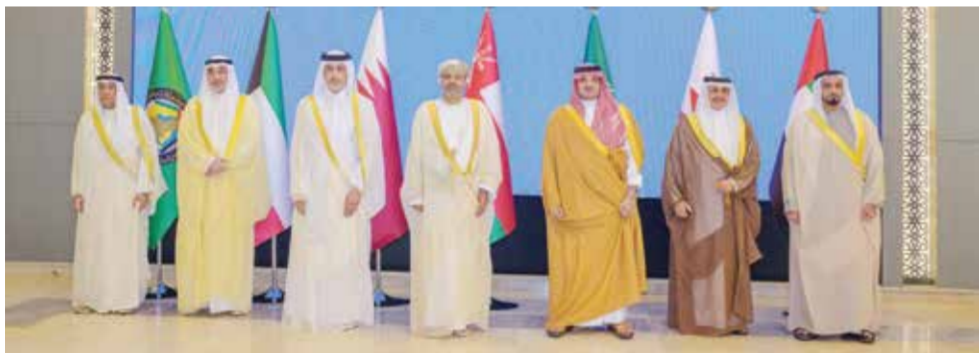
○ وزراء داخلية دول مجلس التعاون خلال اجتماعهم بالرياض.

جاء ذلك لدى لقاء سموه في قصر الرفاع أسد الفريق نيكولاس بييري رئيس العمليات المشتركة البريطانية والوفد المرافق، وأشاد سموه بالعلاقات الاستراتيجية الثنائية بين