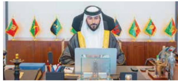
○ سمو الشيخ ناصر بن حمد خلال مشاركته في الاجتماع.