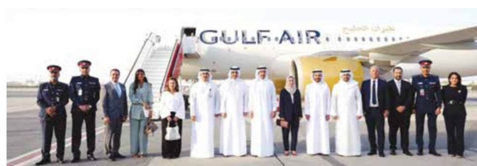
○ وزيراً المواصلات والسياحة خلال مشاركتهما في الرحلة التجريبية.