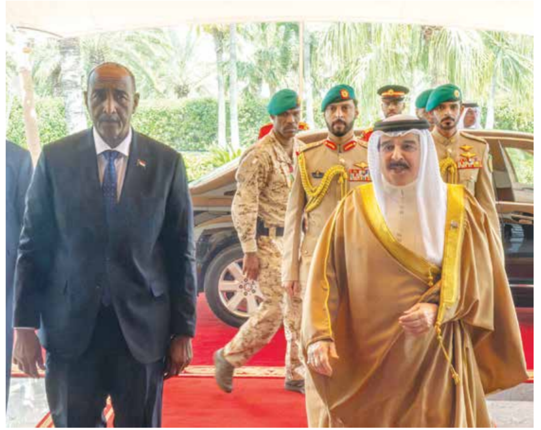
○ جلالة الملك المعظم خلال استقباله رئيس مجلس السيادة الانتقالي بالسودان.

كما جرى خلال اللقاء بحث مجريات الأحداث في المنطقة والتطورات الإقليمية والدولية موضع الاهتمام المشترك، بالإضافة إلى مستجدات الأوضاع الراهنة في السودان، والجهود المبذولة للتوصل إلى وقف دائم لإطلاق النار، بما يليق بتطلعات الشعب السوداني نحو تحقيق السلم والاستقرار، والحفاظ على سيادة السودان ووحدة وسلامة أراضيه، وتسهيل إيصال المساعدات الإنسانية والإغاثية من دون عوائق إلى جميع أنحاء السودان.