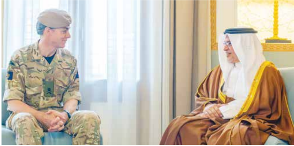
○ سمو ولي العهد رئيس الوزراء خلال لقاء رئيس العمليات المشتركة البريطانية.