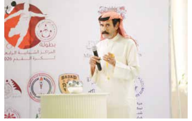
○ جانب من القرعة.

وبعد ذلك، قاد المنصوري سيارته هوندا سيفيك إلى فوز كبير بعد 15 لفة في السباق الأول، حيث حقق المركز الأول