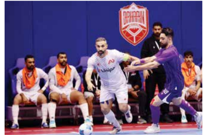
○ جانب من النهائي الأول.

بعدها ألقى مدير الدعم والخدمات بوزارة شؤون الشباب هاشم الكوهجي كلمة أشاد خلالها بجهود اللجنة المنظمة والدور الذي تقوم به المراكز الشبابية في احتضان الطاقات الرياضية والشبابية، متمنياً التوفيق لجميع الفرق المشاركة.