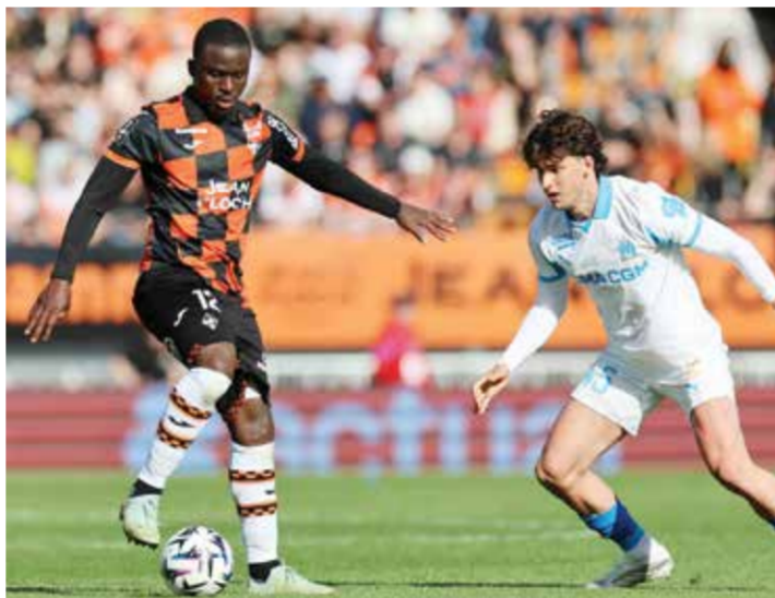
○ من لقاء توربان ومارسيليا

الخامس والسادس، حيث يحل ليل ضيفاً على باريس سان جيرمان حامل اللقب، بينما يلعب رين مع ستراسبورج صاحب المركز الثامن. واصل «بصفتي المسؤول عن الفريق وصاحب القرارات، فأنتي أنتحل مسؤولية هذه الخسارة». وكشف المدرب السنغالي «قلت للاعبين إننا قد ننام ليلة الأحد ونحن في المركز السادس، وإذا لم يكن ذلك صدمة لنا، فإن هذا يعني أننا لا نستحق المشاركة في دوري أبطال أوروبا». وختم تصريحاته «أنتظر الكثير من فرقي، هناك لاعبون لم يستغلوا الفرصة لإثبات أنفسهم في نهاية الموسم، وإذا وجدت نفسي مضطراً للدفع بعناصر شابة لديها حافز قوي لتحقيق الفوز، فلن أتردد في ذلك، وأنا كمدرّب سأقاتل النهاية».