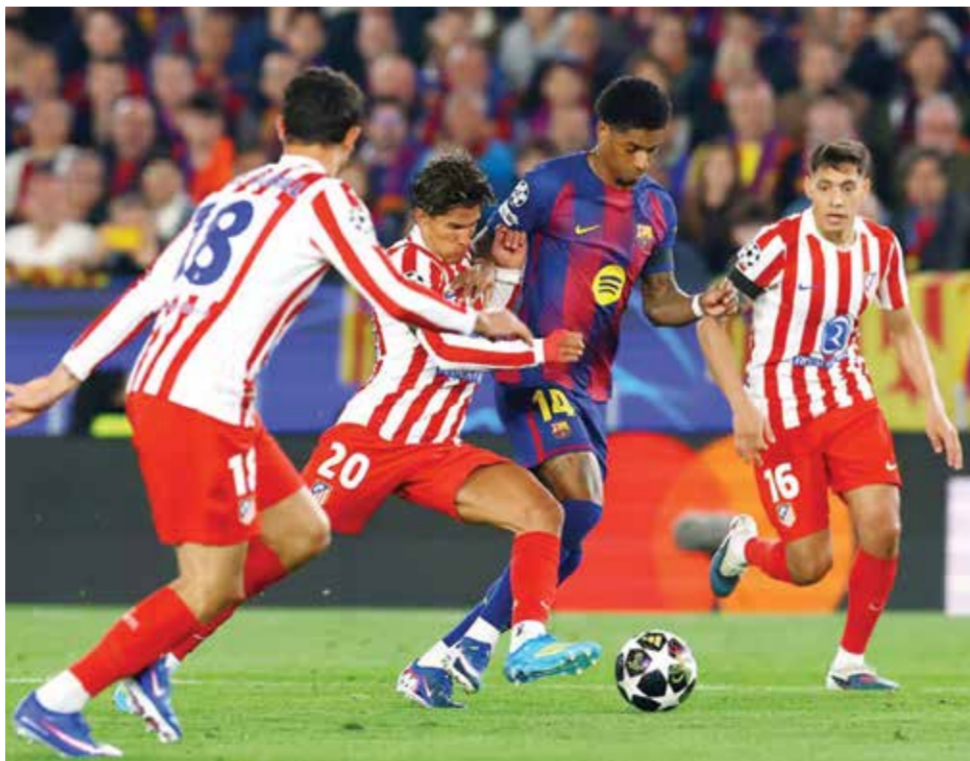
○ من لقاء برشلونة وأتلتيكو في الذهاب.

وغاب ساكا عن مباريات أرسنال الثلاث الأخيرة، في حين لم يكن القائد أوديجارد الذي عانى من إصابات متكررة هذا الموسم، جاهزا للمشاركة في خسارة أرسنال أمام بورنموث نهاية الأسبوع الماضي. أما تيمير، وهو أحد أفضل لاعبي أرسنال هذا الموسم، فكانت آخر مشاركة له قبل شهر في الفوز 0-2 على إيفرتون. ويدخل أرسنال لمواجهة اليوم الأربعاء على ملعب الإمارات متقدما بفارق ضئيل 1-0 على سبورتنغ بفضل انتصاره ذهابا الأسبوع الماضي بهدف متأخر للألماني كاي هافيرتس.