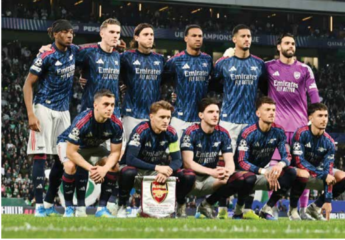
○ فريق أرسنال.