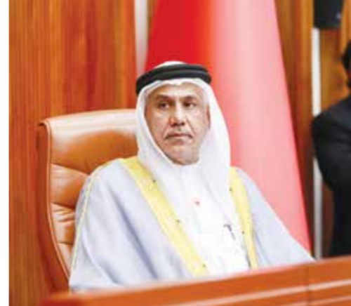
لأنهم أصحاب تخصص وبمجرد ان يأخذوا دورات في المحاماة يستطيعون الترافع في المحاكم الشرعية، مضيفا