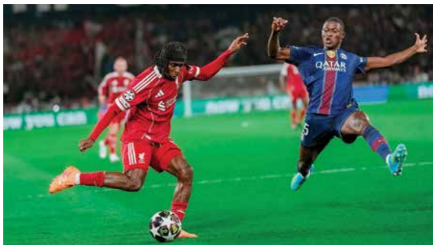
○ من لقاء سان جرمان وليفربول.