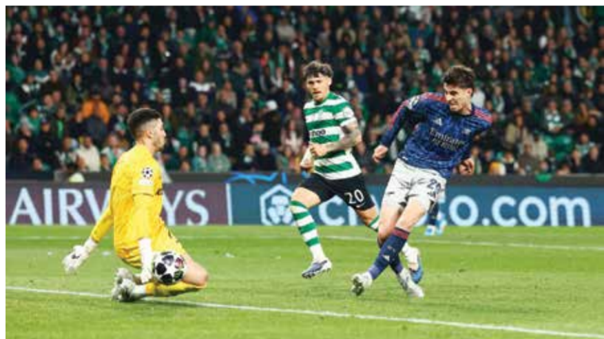
○ من لقاء أرسنال وسبورتنغ.