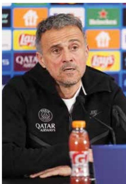
○ إنريكي. (أ ف ب)

وعلى أمل استحضار روح فريق موسم 2019-2028 الذي قلب تأخره 0-3 ذهابا إلى فوز 4-0 على برشلونه، فإن تحقيق 16 فوزا في آخر 20 مباراة أوروبية على أرضه (خسارة 4) من شأنه أن يمنح