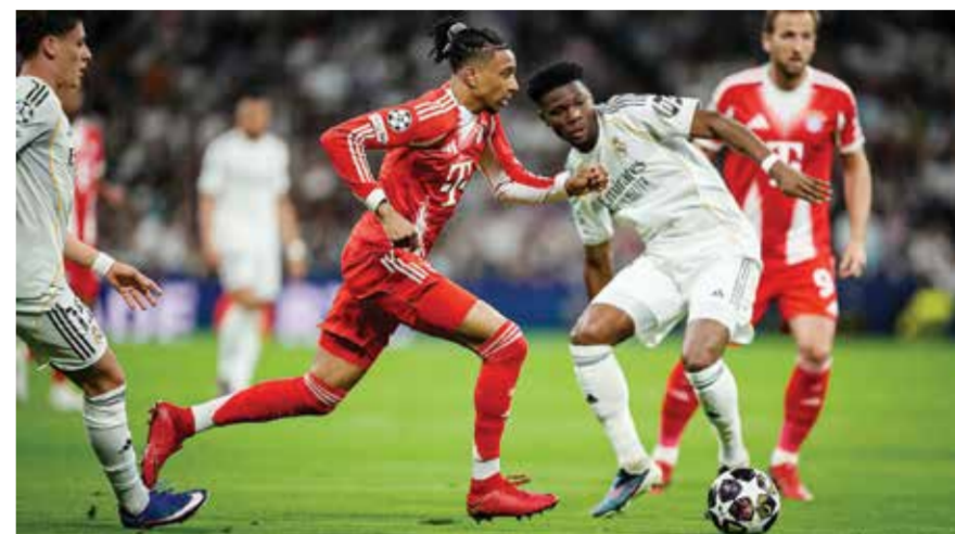
○ من لقاء ريال مدريد وبايرن.