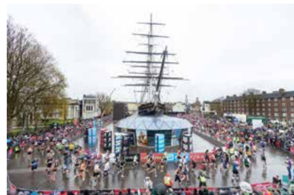
○ من سباقات الماراثون.

ويتأخر كل من ماجيك وسفنتي سيكسرز وهورنتس بنصف مباراة عن تورونتو رابتورز، صاحب المركز السادس والأخير المؤهل مباشرة للأدوار الإقصائية في الشرقية.