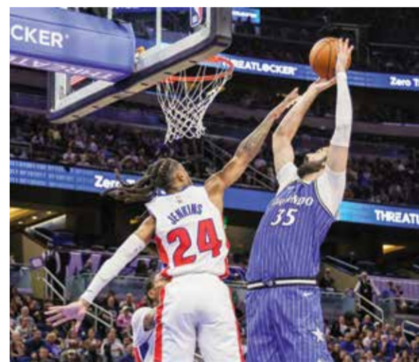
○ من لقاء ماجيك ويبستونز