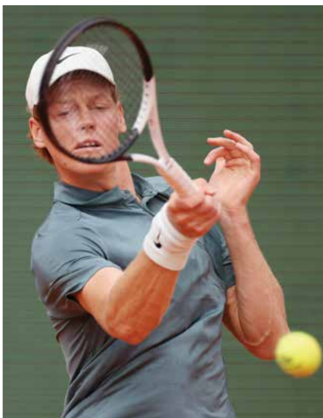
○ سينر،

تحدث ميتش جونسون مدرب سبيرز عن حالة ويمبانيا من دون أن يقدم مزيداً من التفاصيل في المؤتمر الصحفي، قائلاً «أعتقد أن عودته للعب في الدقائق الأربع أو الخمس الأخيرة من الشوط كانت مؤشراً إيجابياً».