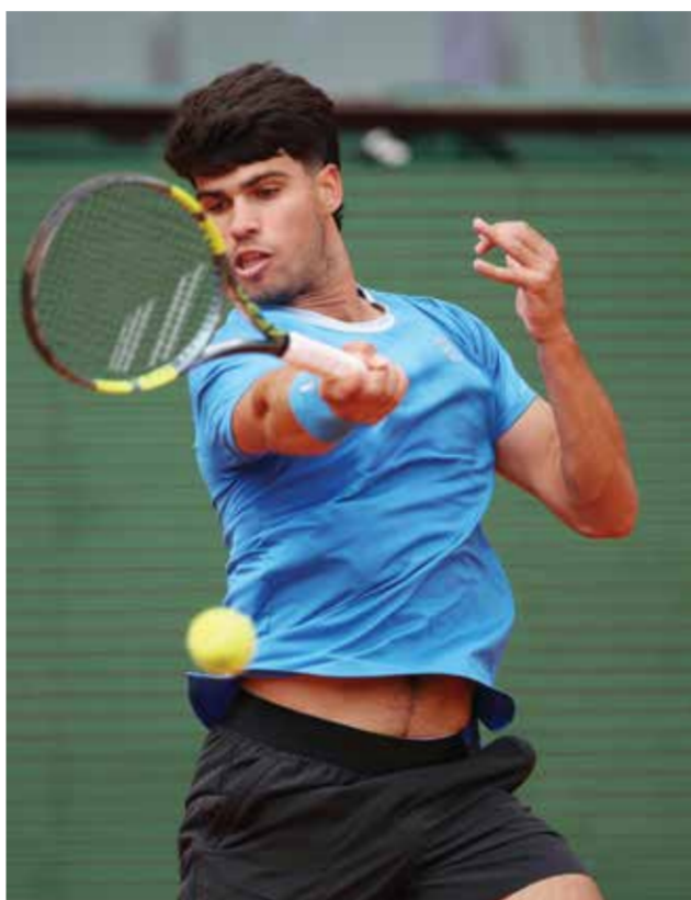
○ ألكاراس، (أ ف ب)

ويواجه سينر في الدور التالي الأرجنتيني فرانسيسكو سيرونودولو التاسع عشر.