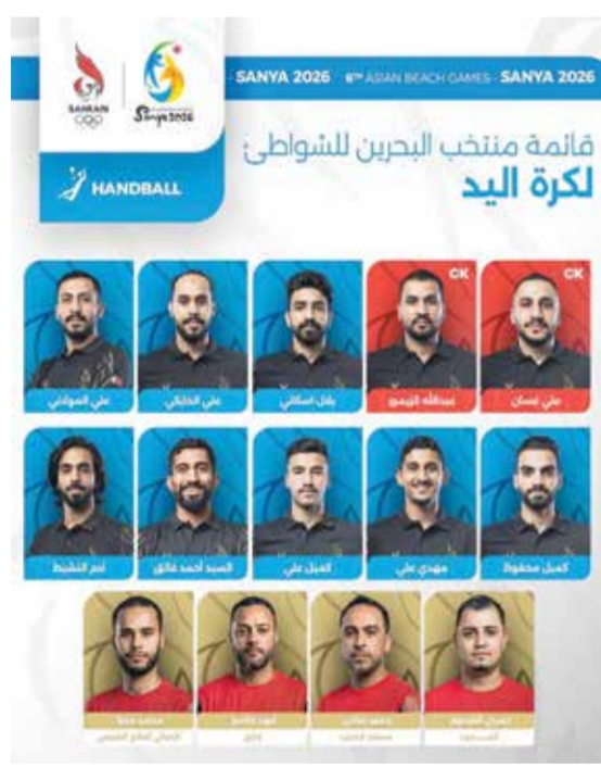
○ قائمة منتخب اليد الشاطئية.