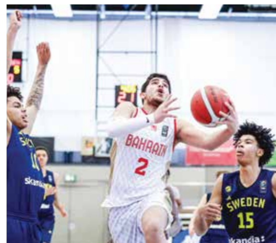
○ من لقاء منتخبنا أمام السويد.

ويدخل منتخبنا اللقاء سعياً لتحقيق فوزه الأول في البطولة، بعد ثلاث مواجهات صعبة أمام منتخبات قوية تمثلت في ألمانيا والسويد وسلوفينيا، حيث يتطلع إلى استعادة توازنه وتقديم مستوى أفضل في هذه المواجهة. وتشكل هذه المشاركة محطة مهمة في مسار إعداد المنتخب، إذ يمنح الاحتكاك مع منتخبات ذات مستويات متقدمة فرصة حقيقية لرفع نسق الأداء وتطوير الجوانب التكتيكية لدى اللاعبين، إلى جانب تعزيز الانسجام داخل المجموعة، كما يسعى الجهاز الفني إلى استثمار هذه التجارب في تجهيز الفريق للاستحقاقات القادمة، وفي مقدمتها البطولة الخليجية، بما يعزز حظوظه في المنافسة على بطاقة التأهل إلى نهائيات كأس آسيا.