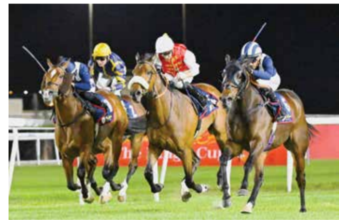
○ نقطة من السباقات الأسبوعية

● الشوط الخامس: كأس شركة باس (سبرنت)، لسباق التوازن «مستورد»، مسافة 1200 متر مستقيم، وبمشاركة 15 جواداً. ● الشوط السادس: كأس إمباير ليمو، لسباق التوازن «إنتاج البحرين»، مسافة 1200 متر مستقيم، وبمشاركة 8 جواداً. ● الشوط السابع: كأس غرناطة، لسباق التوازن «مستورد»، مسافة 1000 متر، وبمشاركة 9 جواداً. ● الشوط الثامن: كأس شركة باس، لسباق التوازن «إنتاج البحرين»، مسافة 2000 متر، وبمشاركة 11 جواداً. ● الشوط التاسع: لسباق التوازن «مستورد»، مسافة 2200 متر، وبمشاركة 9 جواداً. ● الشوط العاشر والأخير: لسباق التوازن «إنتاج البحرين»، مسافة 2400 متر، وبمشاركة 13 جواداً.