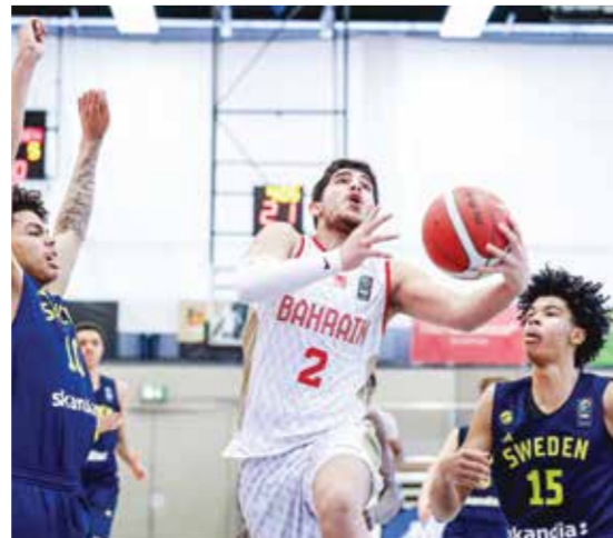
○ من لقاء منتخبنا أمام السويد.

ويدخل منتخبنا اللقاء سعياً لتحقيق فوزه الأول في البطولة، بعد ثلاث مواجهات صعبة أمام منتخبات قوية تمثلت في ألمانيا والسويد وسلوفينيا، حيث يتطلع إلى استعادة توازنه وتقديم مستوى أفضل في هذه المواجهة. وتشكل هذه المشاركة محطة مهمة في مسار إعداد المنتخب، إذ يمنح الاحتكاك مع منتخبات ذات مستويات متقدمة فرصة حقيقية لرفع نسق الأداء وتطوير الجوانب التكتيكية لدى اللاعبين، إلى جانب تعزيز الانسجام داخل المجموعة، كما يسعى الجهاز الفني إلى استثمار هذه التجارب في تجهيز الفريق للاستحقاقات القادمة، وفي مقدمتها البطولة الخليجية، بما يعزز حظوظه في المنافسة على بطاقة التأهل إلى نهائيات كأس آسيا.