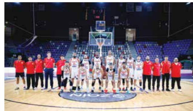
○ فريق المحرق.

يمنح هذه السلسلة طابعاً خاصاً مفتوحاً على جميع الاحتمالات. أسلوب اللعب