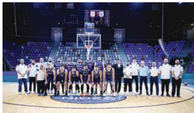
○ فريق المنامة.

تقام سلسلة النهائي بنظام «Best of 5»، حيث يتوج باللقب الفريق الذي يحقق ثلاثة انتصارات، ما يفتح الباب أمام سيناريوهات متعددة في ظل إمكانية التعويض، الأمر الذي يتطلب من الفريقين إدارة الجهد البدني والذهني بشكل مثالي، والحفاظ على الاستقرار الفني حتى نهاية السلسلة.