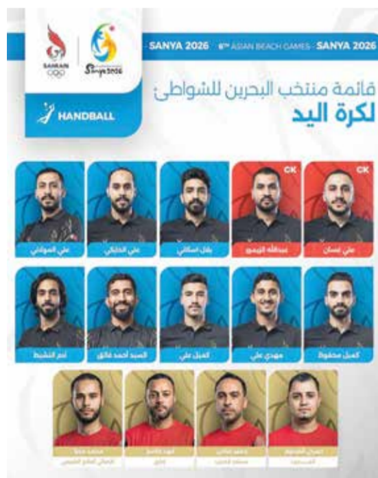
○ قائمة منتخب اليد الشاطئية.