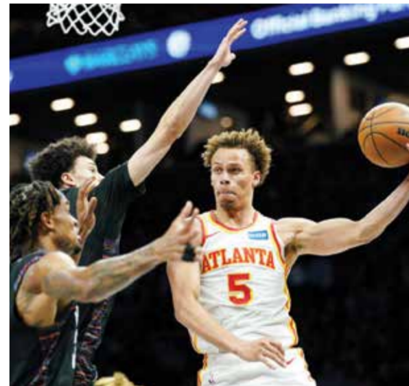
○ من لقاء هوكس ومنتس.