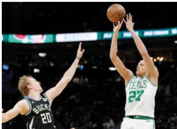
○ من لقاء سلتيكس وباكس.