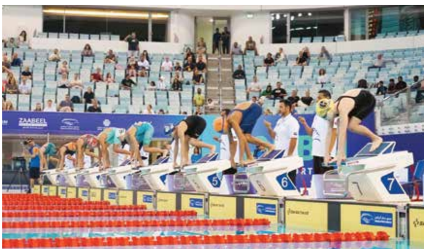
○ منافسات سابقة في السباحة.