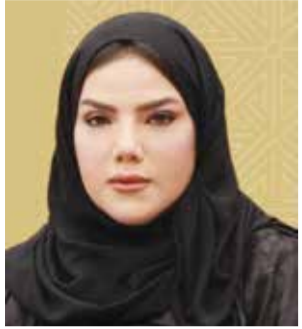
○ سبيكة الفضالة.