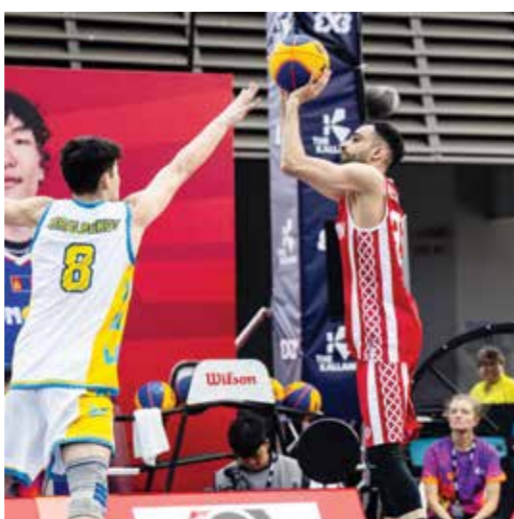
○ من مشاركة منتخب الرجال