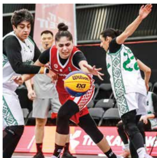
○ من مشاركة منتخب السيدات

الرجال والسيدات قدما مستويات فنية جيدة تعكس تطور كرة السلة 3*3 في المملكة، وتؤكد التقدم الملحوظ في الحضور التنافسي على المستوى الآسيوي.