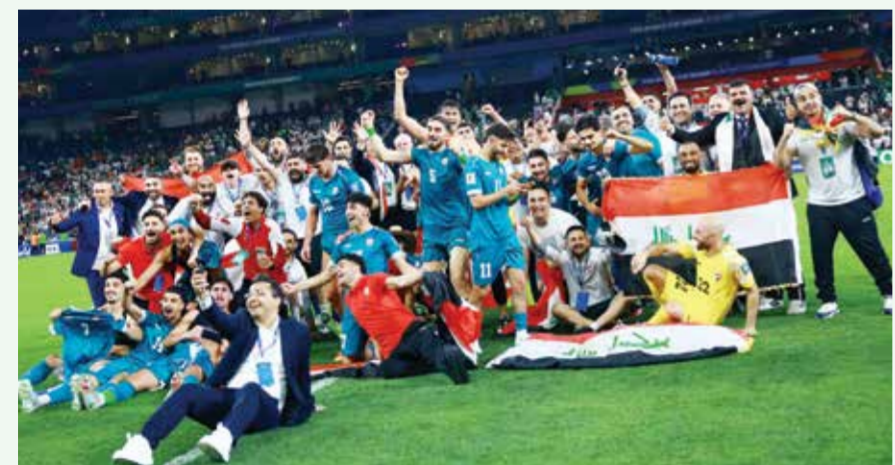
○ احتفالية لاعبي العراق.

ووصف درجال فوز العراق في مدينة مونثيري بأنه «ملحة كروية» مشيراً إلى أن اللاعبين خاضوا «مباراة العمر من أجل إسعاد شعبهم» وأن المدرب جراهام أرنولد