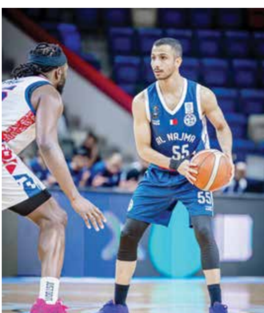
○ من لقاء المنامة والنجمة.

وفي المواجهة الأخرى واصل فريق المنامة تقدمه في سلسلة مواجهات الدور نصف النهائي بعدما حقق فوزه الثاني على التوالي أمام منافسه النجمة بنتيجة (92-95)، ليعزز موقعه في المنافسة ويقترّب من مرافقة المحرق إلى المباراة النهائية.