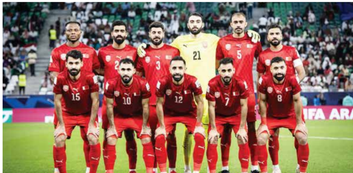
○ منتخبنا الوطني الأول لكرة القدم.

الجدير بالذكر أن منتخبنا أقام في شهر مارس الماضي تجمعاً محلياً شارك فيه 30 لاعباً، اختارهم المدرب دراغان تالاييتش، وخاض خلاله مناوئتين جادتين من أجل الاستعداد للاستحقاقات القادمة.