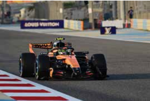
○ لحظة من تجارب سابقة.

ستُهمّد تجارب ما قبل الموسم الطريق لانطلاق الموسم الجديد، الذي سيبدأ بعد أسبوعين من التجارب مع سباق جائزة أستراليا الكبرى، المقرر إقامته في الفترة من 6 إلى 8 مارس. ويستمر الموسم بسباقات في الصين واليابان، قبل العودة لسباق جائزة البحرين الكبرى للفورمولا وان لعام 2026، الذي يُقام في الفترة من 10 إلى 12 أبريل، وهو الجولة الرابعة من بطولة العالم المكوّنة من 24 سباقًا.