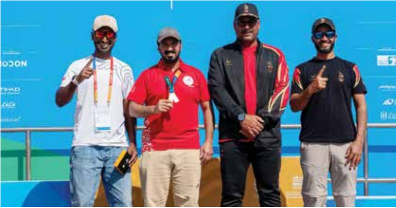
○ صورة جماعية.