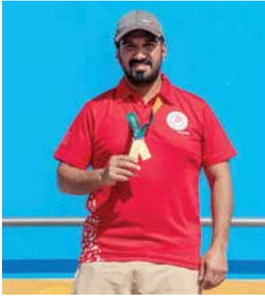
○ تتويج سمو الشيخ خليفة بن سلمان.

حقق سمو الشيخ خليفة بن سلمان بن محمد آل خليفة، وكيل وزارة العمل، رئيس الاتحاد البحريني للرماية، المركز الأول والميدالية الذهبية في منافسات رماية الشوژن «سبكيت» ضمن دورة ألعاب الماسترز الدولية أبوظبي 2026، والمقامة في مدينة العين بدولة الإمارات العربية المتحدة.