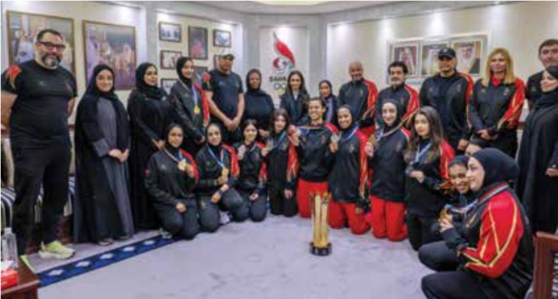
○ صورة جماعية.