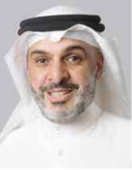
○ الشيخ محمد بن دعيج آل خليفة.

واختتم بتصريحه بتأكيد أن اللجنة البارالمبية البحرينية ماضية في تطوير رياضات ذوي العزيمة وتعزيز حضورها في المحافل الدولية، بما ينسجم مع أهداف التنمية المستدامة، مشيداً بالدعم الذي تحظى به الرياضة البحرينية، ومنطلعا إلى مواصلة تحقيق المزيد من النجاحات في الاستحقاقات القادمة.