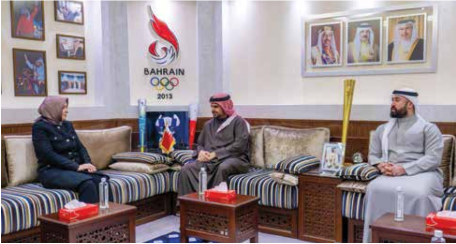
○ جانب من اللقاء.