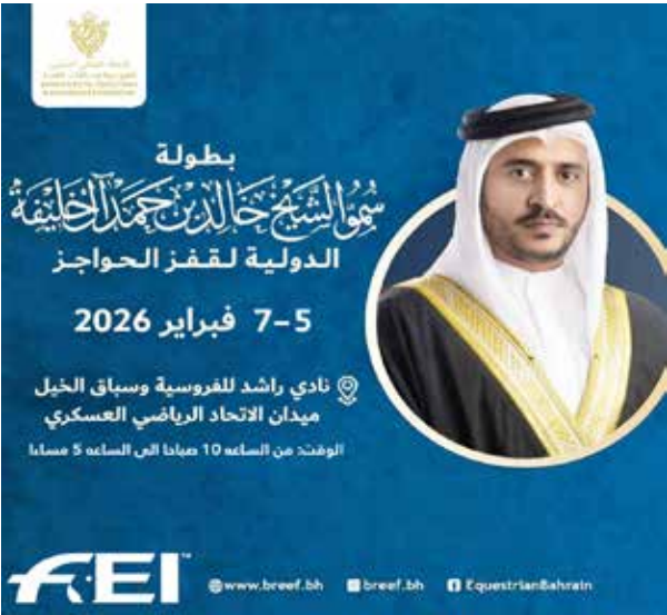
○ بوستر البطولة.