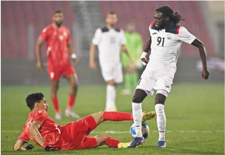
○ من لقاء الاتفاق وسترة.

تحت رعاية سمو الشيخ خالد بن حمد آل خليفة النائب الأول لرئيس المجلس الأعلى للشباب والرياضة، رئيس الهيئة العامة للرياضة، رئيس اللجنة الأولمبية البحرينية يستعد الاتحاد الملكي البحريني للفروسية وسباقات القدرة لتنظيم بطولة سمو الشيخ خالد بن حمد آل خليفة الدولية لقفز الحواجز (ذي النجمة الواحدة) التي ستقام على ميدان الرقة بالاتحاد الرياضي العسكري خلال الفترة من 5 حتى 7 من شهر فبراير الجاري.