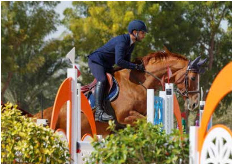
○ جانب من المنافسات – أرشيضية.