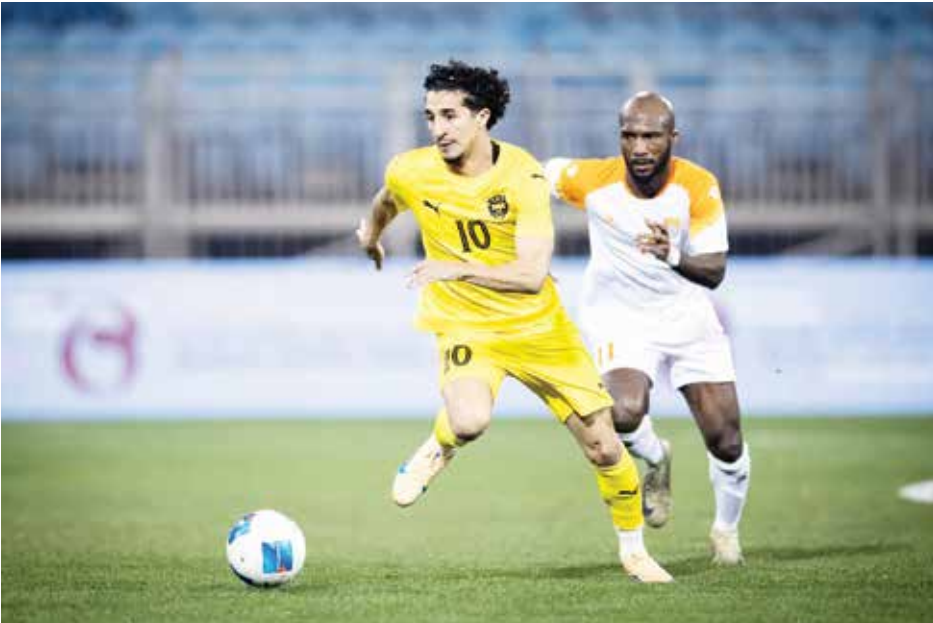
○ من لقاء الخالدية والحالة.