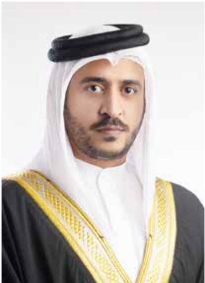
○ سمو الشيخ خالد بن حمد آل خليفة.