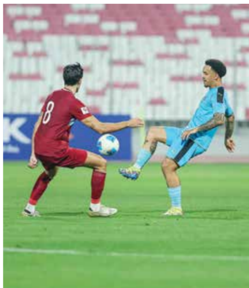
○ من لقاء عالي مع الشباب بالموسم الماضي.

البحرين كمركز إقليمي بارز في استضافة الأحداث الرياضية الكبرى، وتعزيز حضورها على خارطة الرياضة الدولية.