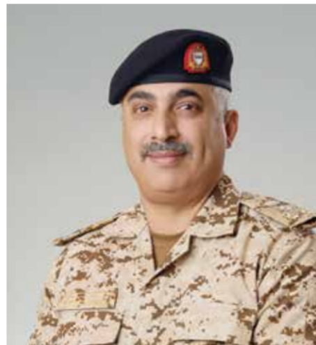
○ المعيد طبيب الشيخ فهد بن سلمان آل خليفة

بناءً على توجيهات سمو الشيخ خالد بن حمد آل خليفة، النائب الأول لرئيس المجلس الأعلى للشباب والرياضة، رئيس الهيئة العامة للرياضة، رئيس اللجنة الأولمبية البحرينية، رئيس اللجنة العليا المنظمة لدورة الأسوية الثالثة للشباب التي ستحتضنها مملكة البحرين من ٢٢ حتى ٣١ أكتوبر ٢٠٢٥ المقبل، وفي إطار التحضيرات الجارية لاستضافة هذه الدورة، أعلنت الخدمات الطبية الملكية جاهزيتها الكاملة لتقديم التغطية الطبية الشاملة للفعاليات، وذلك بالتعاون مع وزارة الصحة، المستشفيات الحكومية، مراكز الرعاية الصحية الأولية والإسعاف الوطني وكل المؤسسات الصحية ذات العلاقة.