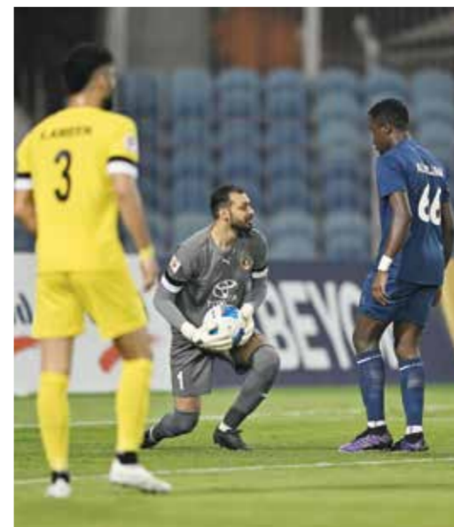
○ من لقاء النجمة مع الأهلي في الموسم الماضي.