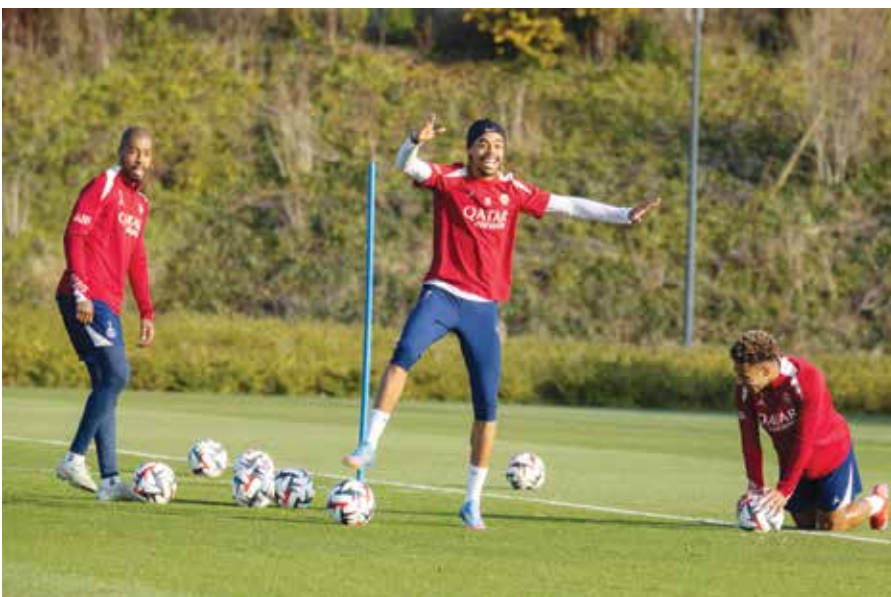
○ تدريبات سان جرمان

بعدما قرر بنفسه تقليص الايام الاربعة المحصنة للراحة التي منحها دي تزييري للاعبيه خلال التوقف الدولي.