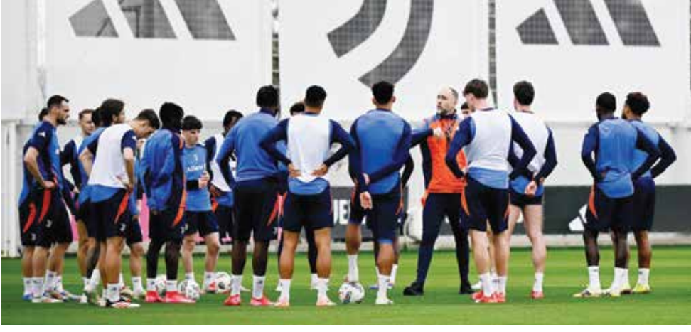
○ تدريبات يوفنتوس

قادر على الاحتفاظ باللقب بعد فوزه في المرحلة الماضية على أتالانتا الثالث ٢-٠ خارج الديار. في المقابل، يمر ميلان بمرحلة انتعاش بعد فوزه بمباراته الأخيرتين على ليتشي وكومو، لكن الأمور ستكون هذه المرة أصعب بالتأكيد على رجال المدرب البرتغالي سيرجيو كونسيساو في مواجهة نابولي الذي فاز ذهابا في «سان سيرو» بهدفين نظيفين. ومن جهته، سيحاول أتالانتا استعادة توازنه والتمسك بأمل المنافسة على اللقب في ظل فارق النقاط الست الذي يفصله عن إنتر، لكن المهمة لن تكون سهلة الأحد في ضيافة فيورنتينا الذي أذل يوفنتوس في مباراته الأخيرة ٣-٠.