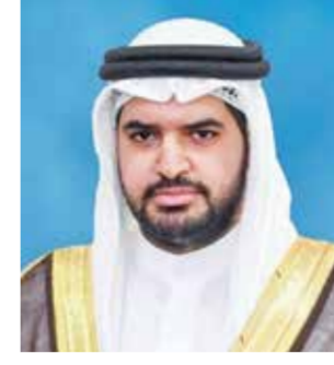
○ سمو الشيخ عيسى بن علي.

الذكري السابعة والخمسين لتأسيس قوة دفاع البحرين. كما تلقى صاحب السمو الملكي الأمير سلمان بن حمد آل خليفة ولي العهد رئيس مجلس الوزراء، برفقة تهنئة من سمو الشيخ عيسى بن علي آل خليفة وكيل وزارة شؤون مجلس الوزراء، رفقا فيها إلى المقام السامي لحضرة صاحب الجلالة الملك المعظم أسمي آيات النهاني والتبريكات بمناسبة