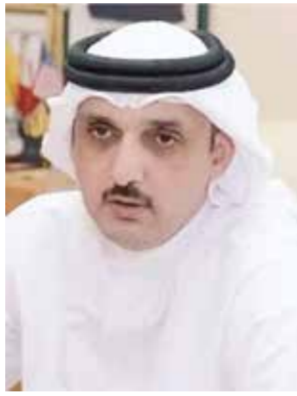
○ اللواء بسام المعراج.

والفداء، سائلاً الله تعالى أن يحفظ الجميع ويحقق بهم قادة في خدمة الوطن في ظل قيادة حضرة صاحب الجلالة الملك حمد بن عيسى آل خليفة ملك البلاد المعظم القائد الأعلى للقوات المسلحة، داعياً سموه ويمتعه بالصحة والسعادة وأن تبقى البحرين واحة أمن واستقرار. وقد بعث صاحب السمو الملكي ولي العهد نائب القائد الأعلى للقوات المسلحة رئيس مجلس الوزراء برفقة شكر جوابية إلى رئيس جهاز المخابرات الوطني، ضمنها سموه والشكر والتقدير على تهنائه بمناسبة الذكرى السابعة والخمسين لتأسيس قوة دفاع البحرين، مؤكداً جلالته اعترازه والذاكرة الوطنية كل معاني العزة والفخر، معرباً عن اعتزازه بما وصلت إليه قوة دفاع البحرين وبمزيد من التطور والازدهار في ظل قيادة حضرة صاحب الجلالة الملك حمد بن عيسى آل خليفة ملك البلاد المعظم القائد الأعلى للقوات المسلحة.