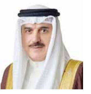
○ رئيس مجلس النواب.

تلقي حضرة صاحب الجلالة الملك حمد بن عيسى آل خليفة ملك البلاد المعظم القائد الأعلى للقوات المسلحة برفقة تهنئة من سمو الشيخ نوح بن محمد بن سلمان آل خليفة وسمو الشيخ علي زين العابدين بن محمد بن سلمان آل خليفة، رفقا فيها إلى مقام جلالته السامي أسمي آيات النهاني والتبريكات بمناسبة