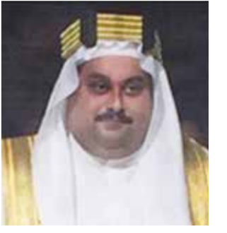
○ سمو الشيخ عبدالله الفاتح.

تلقي حضرة صاحب الجلالة الملك حمد بن عيسى آل خليفة ملك البلاد المعظم القائد الأعلى للقوات المسلحة برفقة تهنئة من سمو الشيخ عبدالله الفاتح بن محمد بن سلمان آل خليفة، رفقا فيها إلى مقام جلالته السامي أسمي آيات النهاني والتبريكات بمناسبة