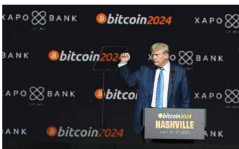
وكان ترامب وصف العملات الرقمية خلال ولايته الأولى بأنها نصب واحتيال، لكنّ موقفه تغيرَ بالكامل في هذا الشأن، حتى إنه أطلق عملته الرقمية

الخاصة، متعهداً جعل الولايات المتحدة «العاصمة العالمية للبتكوين والعملات الرقمية». وترتكز البتكوين التي ولدت في العام ٢٠٠٨ وكان الغرض منها في البداية التهرب من رقابة المؤسسات المالية التقليدية، على تقنية «سلسلة الكتل» التي تقوم مقام سجل افتراضي غير قابل للتزوير يحفظ أثر كل الصفقات المبرمة. وتسعى الهيئات الناطمة إلى سدّ الثغرات القانونية المحيطة بهذه الأصول الرقمية التي غالباً ما كانت موضع جدل ومازالت تعتبر من الوسائل المستخدمة لغسل الأموال أو الاحتيال على أفراد.