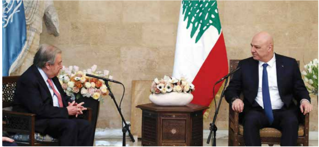
○ الرئيس اللبناني خلال مباحثاته مع جوتيريش في بيروت.

بيروت - الوكالات: طالب الرئيس اللبناني جوزيف عون أمس إسرائيل بالانسحاب من جنوب لبنان بحلول ٢٦ يناير، وهي المهلة المحددة لتنفيذ شروط وقف إطلاق النار بين حزب الله وإسرائيل الذي أبرم في نوفمبر ٢٠٢٤.