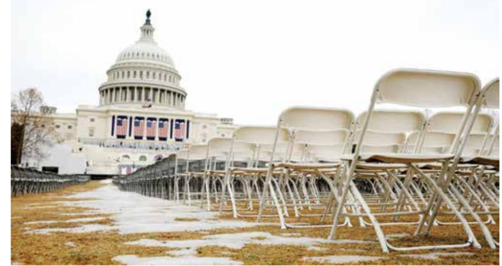
○ ظروف جوية قاسية خارج مبنى الكابيتول. (أ ف ب)

واشنطن - (أ ف ب): أعلن الرئيس الأمريكي المنتخب دونالد ترامب أن مراسم تنصيبه ستجرى داخل مبنى الكابيتول للمرة الأولى منذ أربعين عاما لأن مصلحة الأرصاد الجوية تتوقع أن تكون الحرارة ١٢ درجة دون الصفر صباح يوم غد الاثنين وست درجات تحت الصفر ظهرا مع رياح جليدية، عندما يقسم الرئيس السابع والأربعون للولايات المتحدة اليمين.