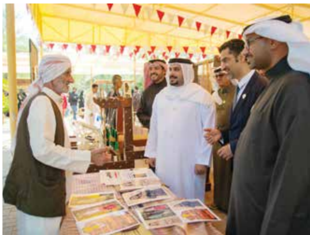
سمو الشيخ محمد بن سلمان بن حمد خلال زيارته لسوق المزارعين.