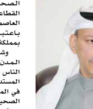
كتبت: مروة أحمد

أكد حسن المدني نائب محافظ العاصمة على حصول محافظة العاصمة على اعتماد الدولي كمحافظة صحية وأول محافظة في إقليم المتوسط بعد إنجازه جديداً يضاف إلى سجلات مملكة البحرين الحافلة بالإنجازات في المجالات الصحية والتنموية والاجتماعية، ويسهم في ترسيخ مكانة المنامة العالمية وريادتها في المنطقة كونها من المدن التي تميزت على الحداثة العالمية في مختلف الجوانب. وقال في حوار خاص مع «أخبار الخليج» إننا في محافظة العاصمة عازمون على الاستمرار في هذا البرنامج من خلال الممارسة والتعلم والتحسين المستمر، وهذا ينبع من الفهم والإدراك العميق لأهداف ومقاصد البرنامج باعتبار المحافظة تمتلك خبرة تراكمية منذ عام ٢٠١٧، وما اكتسبه فريق العمل من خلال زيارات خبراء منظمة الصحة العالمية، ومن أدبيات منظمة الصحة العالمية،