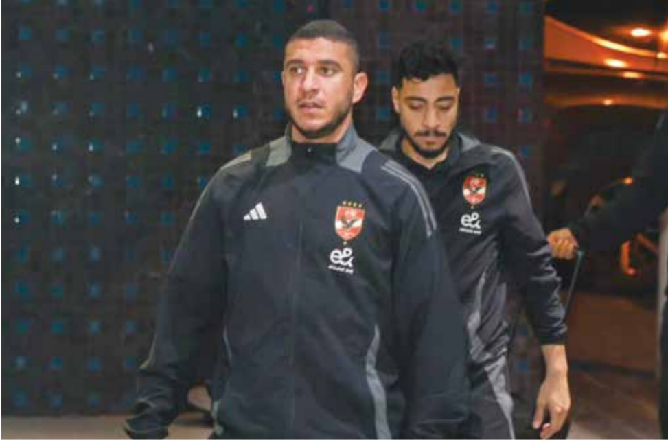
○ فريق الأهلي يصل إلى أبيدجان.

القاهرة - (د ب أ): يسعى الأهلي المصري (حامل اللقب) لتعديل مساره وتحقيق الفوز على مضيفه ستاد أبيدجان الإفريقي وحسم بطاقة التأهل لدور الثمانية ببطولة دوري أبطال إفريقيا لكرة القدم، فيما يحاول الترجي التونسي، وصيف النسخة الماضية، خطف بطاقة تأهله عن المجموعة الرابعة. وتقام مباريات الجولة الخامسة من دور المجموعات على ثلاثة أيام.