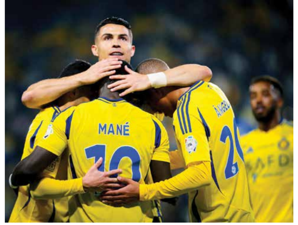
○ احتفال لاعبي النصر.