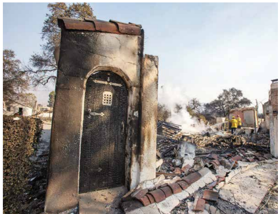
○ منطقة سكنية دمرها الحريق.

بعض هذه الدور الفارسة بملايين الدولارات إلا انها محيت بالكامل. ويبدو حي باسيفيك باليسايدس الممثل على مايبو ومنازلها الواقعة على شاطئ البحر، مقفرا. بعض الدور نجت من الحريق وبعض الشوارع أفلتت كلياً من الدمار. لكن مع الاقتراب من جنوب الحي يتبين أن منازل رائعة استحالت مقابر. فعلى امتداد الشوارع، لم يبق من المنازل العائلية الضخمة سوى مدخنة أو جذوع أشجار متفحمة جراء النيران.