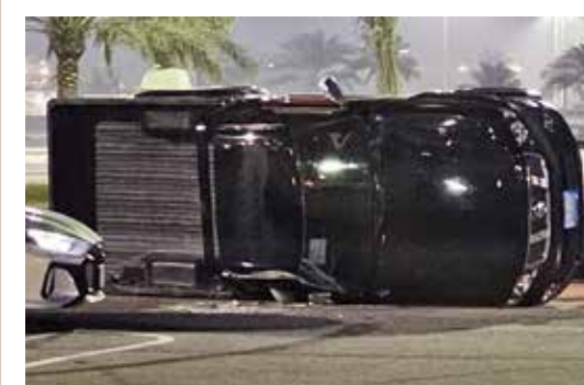
كتب: عبدالأمير السلطنة

نجا خليجي في ساعة متأخرة من مساء يوم (الخميس) بعد أن تدهورت سيارته في مواقف الفورمولا، حيث كان يقود سيارته في مواقف الفورمولا وذلك في الساعة الحادية عشرة من مساء يوم الخميس ويسبب عدم التقيد بأنظمة المرور فقد السيطرة على عجلة القيادة وانقلبت سيارته، نتج الحادث عن تضرر المركبة من دون وقوع إصابات. وقد حضر فور وقوع الحادث سيارة شرطة المرور وتم إعادة السيارة إلى وضعها الطبيعي وإزاحتها من موقع الحادث، وبعدها فتحت الجهات الرسمية التحقيق لمعرفة أسباب الحادث.