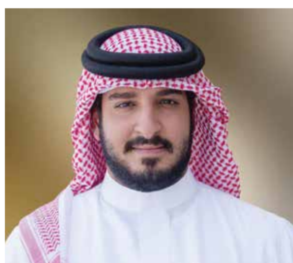
○ سمو الشيخ عيسى بن عبدالله آل خليفة.

رفع سمو الشيخ عيسى بن عبدالله آل خليفة رئيس الاتحاد الملكي البحريني للفرسوسية وسباقات القدرة، أسمى آيات التهاني والتبريكات إلى مقام حضرة صاحب الجلالة الملك حمد بن عيسى آل خليفة ملك البلاد المعظم، وإلى صاحب السمو الملكي الأمير سلمان بن حمد آل خليفة ولي العهد رئيس مجلس الوزراء، بمناسبة فوز المنتخب الوطني لكرة القدم بلقب دورة كأس الخليج العربي السادسة والعشرين لكرة القدم. كما هنا سموه، سمو الشيخ ناصر بن حمد آل خليفة ممثل جلالة الملك للأعمال الإنسانية وشؤون الشباب رئيس المجلس الأعلى للشباب والرياضة، وسمو الشيخ خالد بن حمد آل خليفة النائب الأول لرئيس المجلس الأعلى للشباب والرياضة رئيس الهيئة العامة للرياضة رئيس اللجنة الأولمبية بهذا الإنجاز الكروي المميز. وأعرب سمو الشيخ عيسى بن عبدالله آل خليفة عن فخره واعتزازه بتحقيق المنتخب الوطني لكرة القدم هذه النتيجة المشرفة، والتي تأتي ثمرة من ثمار الرعاية والدعم الذي يوليه جلالة الملك المعظم، واهتمام ومساندة ودعم سمو ولي العهد رئيس مجلس الوزراء لقطاع الرياضة والرياضيين وبخاصة كرة القدم البحرينية.