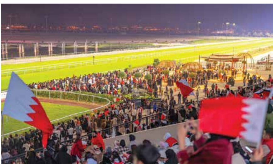
○ الحضور في نادي راشد للفرسوسية