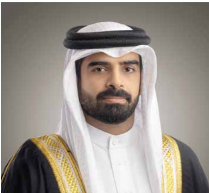
○ سمو الشيخ سلمان بن محمد آل خليفة.

الكبيرة التي بذلها الجهاز الفني تحت قيادة المدرب الكرواتي دراغان تالاييتش بمعاونة المدرب الوطني المساعد مرجان عيد والطاخم الفني المعاون، وكذلك الجهاز الإداري بإدارة مدير المنتخب محمود رياض وجميع من في الطاقم الإداري والطبي وكذلك الإعلامي، للعمل بقلب الفريق الواحد لحصد هذا الإنجاز المتميز الذي سيسطره التاريخ في سجلات هذه الدورة العريقة. وأكد سمو الشيخ سلمان بن محمد آل خليفة أن فوز المنتخب الوطني بلقب خليجي ٢٦ في بداية العام الجديد ٢٠٢٥، يشكل دافعا معنويا كبيرا نحو مضاعفة الجهود في سبيل مواصلة العمل لخوض ما تبقى من مباريات التصفيات المؤهلية بكل عزيمة وإصرار على تحقيق حلم الشارع الرياضي البحريني ببلوغ مونديال كأس العالم ٢٠٢٦، متمنيا سموه كل التوفيق والنجاح لأحمر البحريني في تحقيق المزيد من النجاحات.