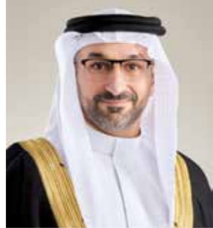
○ وزير الصناعة والتجارة.

كتبت أمل الحامد: صدر عن الشيخ خالد بن عبدالله آل خليفة نائب رئيس مجلس الوزراء قرار بإضافة نشاط تجاري جديد حول خدمات الاستشارات الضريبية التي يجوز للشركات ذات رأس المال الأجنبي بمزاومتها، وبحسب القرار المنشور في الجريدة الرسمية، فإنه على وزير الصناعة والتجارة تنفيذ أحكام هذا القرار، ويعمل به في اليوم التالي لتاريخ نشره في الجريدة الرسمية. وعلى صعيد متصل، صدر عن عبدالله بن عادل فخرو وزير الصناعة والتجارة قرار جديد بشأن شروط وضوابط مزاولة نشاط خدمات الاستشارات الضريبية. وبحسب القرار المنشور في الجريدة الرسمية، فإنه يُسمح للمؤسسات الفردية والشركات التجارية المملوكة