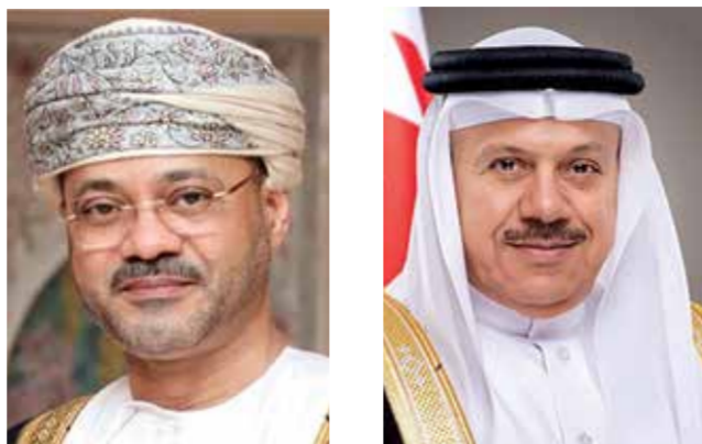
○ وزير الخارجية ○ وزير الخارجية العماني.

تلقى الدكتور عبداللطيف بن راشد الزياني وزير الخارجية أمس اتصالاً هاتفياً من بدر بن حمد بن حمود البوسعيدي وزير الخارجية في سلطنة عمان الشقيقة بمناسبة فوز المنتخب الوطني لكرة القدم ببطولة كأس الخليج العربي لكرة القدم ٢٦ التي أقيمت في دولة الكويت الشقيقة. وأعرب بدر بن حمد بن حمود البوسعيدي عن صادق تهنائه لمملكة البحرين قيادة وحكومة وشعباً بمناسبة فوز منتخب المملكة ببطولة كأس الخليج العربي لكرة القدم ٢٦، في المباراة النهائية التي جمعت الفريقين البحريني والفريق العماني، مشيداً بالمستوى الفني المتميز الذي قدمه الفريقان والروح الرياضية العالية التي عكست علاقات الأخوة والمحبة التي تربط بين البلدين والشعبين الشقيقين، مشيداً