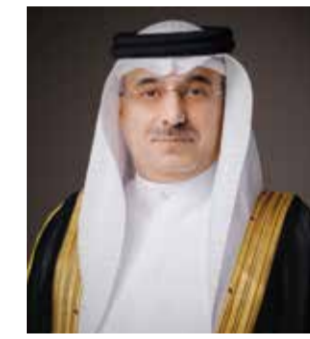
د. محمد العسيري. هذه هي المبادرة الأولى من نوعها التي تقدم مثل هذه الفرصة

إبراهيم العسيري الرئيس التنفيذي للهيئة الوطنية لعلوم الفضاء، في سلسلة ورش العمل التي نظمتها الهيئة الاقتصادية العالمية لوضع مجموعة أدوات نموذجية لبرنامج الفضاء الوطني لدول الحديثة العهد بقطاع الفضاء، حيث تهدف هذه المبادرة إلى إنشاء نموذج معياري يحتذى به للدول التي ترغب في تأسيس قطاعها الفضائي مستفيدة من تجارب من سبقها من الدول والمنظمات الدولية. حول مشاركته، أوضح