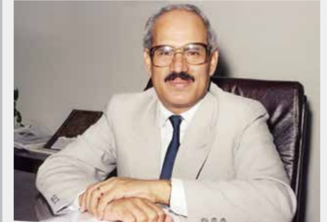
○ الراحل د. محمد جابر الأنصاري.

إطار مشروع نقدي للفكر العربي السائد تطلعا إلى تجديد المشروع النهضوي، كما تميزت رؤيته الفكرية بالتشخيص العيني للواقع العربي في أبعاده السياسية والاجتماعية والحضارية في حقلي التراث العربي الإسلامي وفكر عصر النهضة.