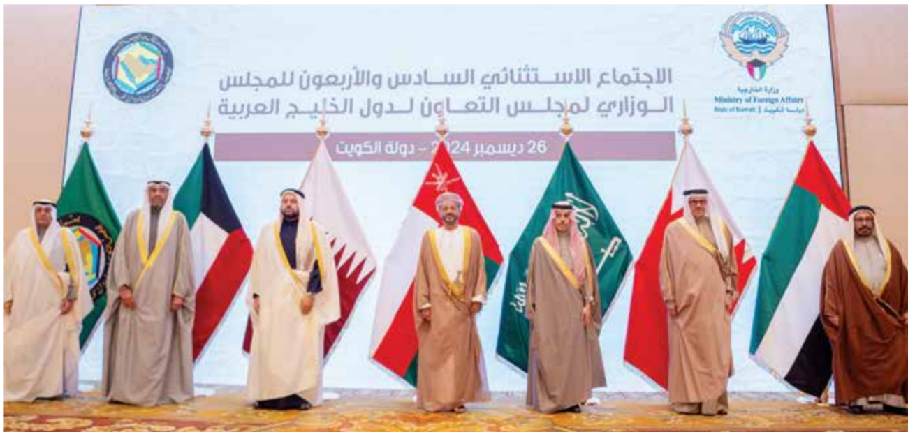
○ جانب من الاجتماع الوزاري الخليجي الاستثنائي بالكويت.

المليشيات والفصائل المسلحة وحصر حمل السلاح بيد الدولة، باعتبار هذه الخطوات ركائز رئيسية للحفاظ على الأمن والاستقرار في سوريا