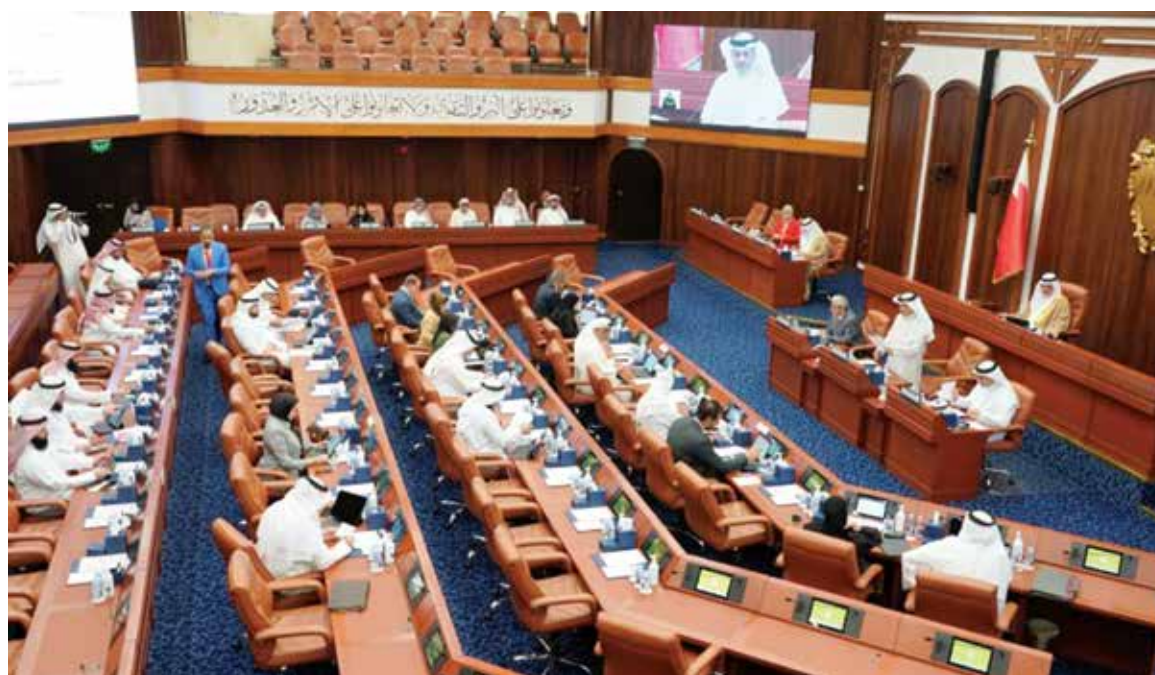
جلسة مجلس النواب. (أرشيفية)

من حيث الامتيازات الوظيفية، وأن إلغاء عدد من الوظائف في الهياكل الحكومية أدى إلى التوسع في اللجوء إلى التعاقدات الخارجية، وتضمنت عقود