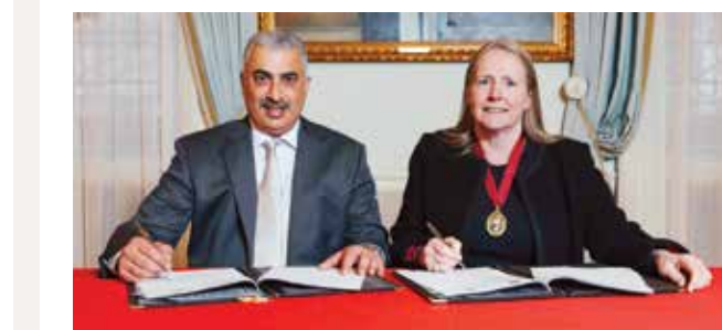
جانب من توقيع الاتفاقية.

ما يعكس بشكل إيجابي على تحسين جودة الرعاية الصحية في مملكة البحرين.