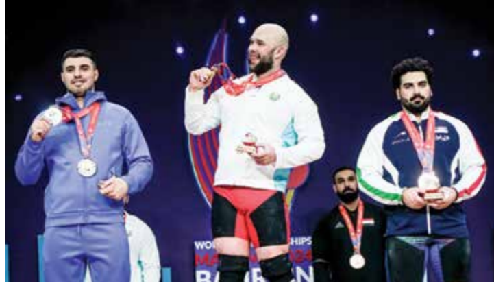
O جانب من التتويج.