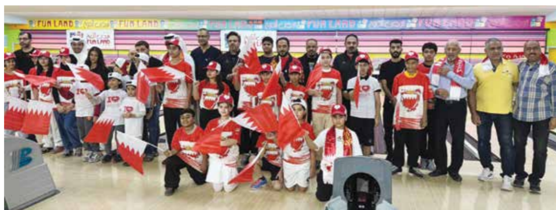
O صورة جماعية.