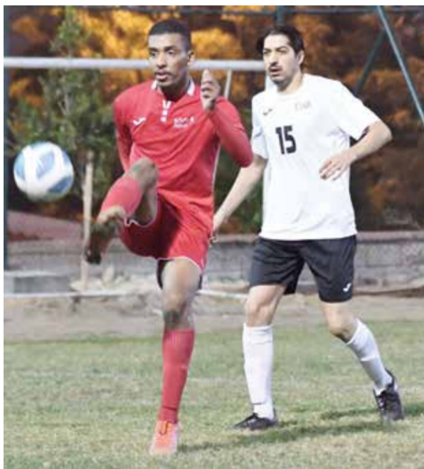
O من لقاء الفريقين في الموسم الماضي.

ويمتلك جور امكانيات فنية عالية وسيدخل البطولة مسلحاً بدعم الجماهير بحثاً عن إنجاز جديد يضيفه إلى سلسلة الإنجازات التي حققتها في الفترة الماضية وكان آخرها في بطولة أولمبياد باريس ٢٠٢٤.