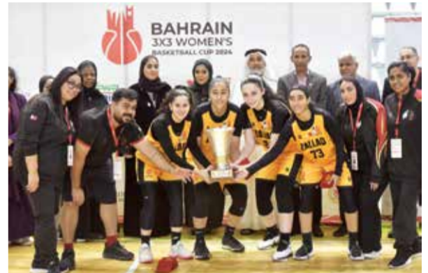
O تتويج فريق الزلاق.