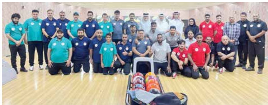
○ صورة جماعية.

وأكد الغدير أن اللجنة سوف تجتهد لتأكيد مكانة مملكة البحرين في احتضان الفعاليات الكبرى، مبيناً إلى أن اللجنة اعتمدت حتى الآن ٤ فنادق من تصنيف ٥ نجوم، وهي جولدن تويب وكراون بلازا والدبلوماسيات والريجنسي، حيث أن هناك تنسيق مع الاتحاد الدولي والاتحادات المشاركة في البطولة من أجل اختيار الفنادق. وأوضح أن لجنة الاستقبال والضيافة تضم