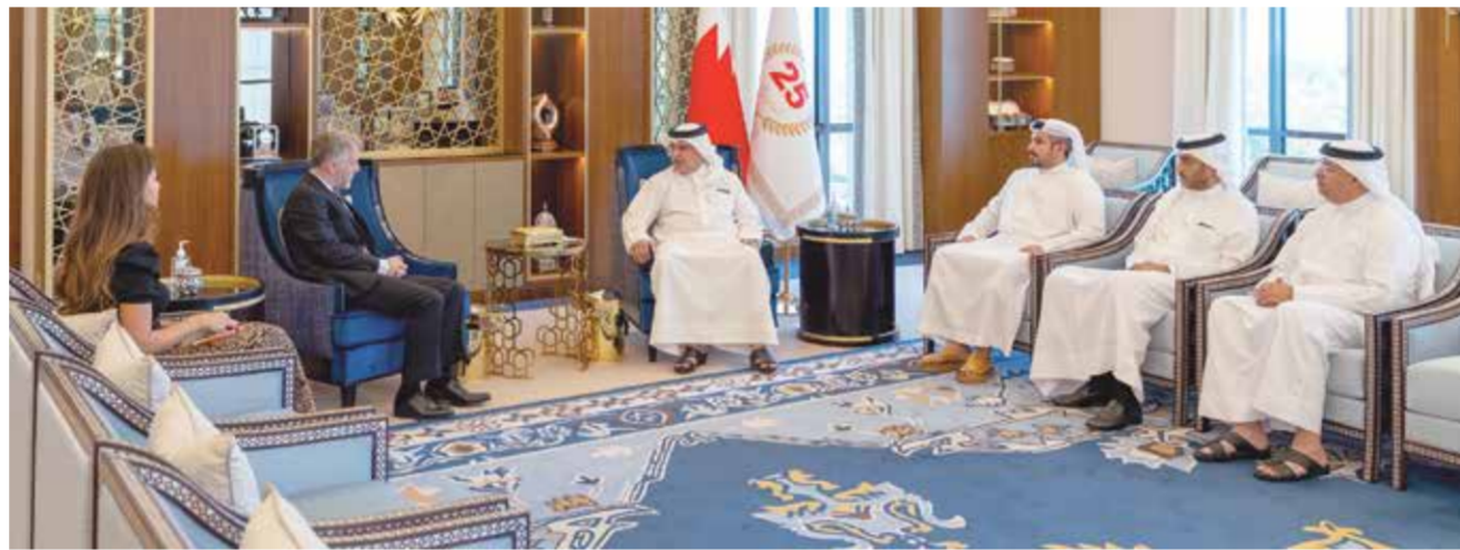
○ سمو ولي العهد رئيس الوزراء خلال استقباله سفير المملكة المتحدة.