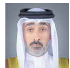
○ الشيخ خالد بن علي

صدر عن حضرة صاحب الجلالة الملك حمد بن عيسى آل خليفة عاهل البلاد المعظم، أمر ملكي رقم (٤٢) لسنة ٢٠٢٤ بتعيين نائب أمين عام مجلس الدفاع الأعلى، جاء فيه: