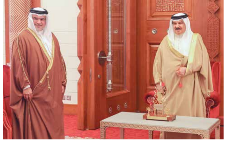
○ جلالة الملك المعظم خلال استقباله وزيرى المواصلات والاتصالات والتنمية الاجتماعية بحضور سمو ولي العهد رئيس الوزراء.