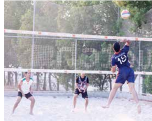
○ جانب من تدريبات منتخب البحرين المدرسي لكرة الطائرة.

طابع التحدي والإثارة إلى البطولة. ويأتي هذا الاستعداد للمنتخب البحريني مواكباً لكافة التحضيرات لاستضافة هذا الحدث الرياضي العالمي، حيث تم تجهيز المنشآت الرياضية والمرافق لاستقبال الفرق والرياضيين في دورة الألعاب المدرسية الدولية «البحرين ٢٠٢٤»، والتي من المتوقع أن تكون محطة بارزة تعكس قدرة المملكة على تنظيم الفعاليات الرياضية الكبرى وتعزز من مكانتها على خارطة الرياضة العالمية.