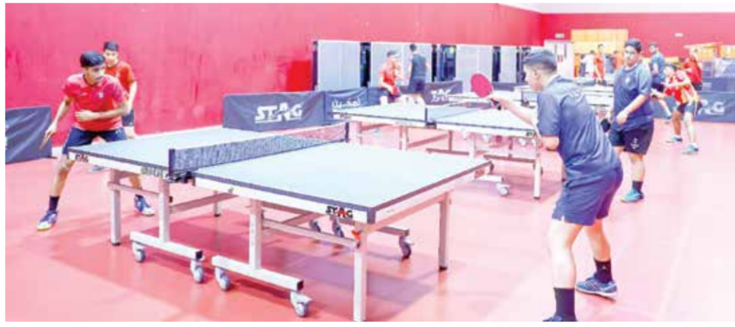
○ جانب من تدريبات منتخب البحرين المدرسي لكرة الطاولة.

واختتم العصفور تصريحه بالتأكيد أن المنتخب لا يسعى فقط للمشاركة، بل للتنافس على المراكز المتقدمة وترك بصمة بارزة، بما يعزز مكانة البحرين على الساحة الرياضية العالمية.