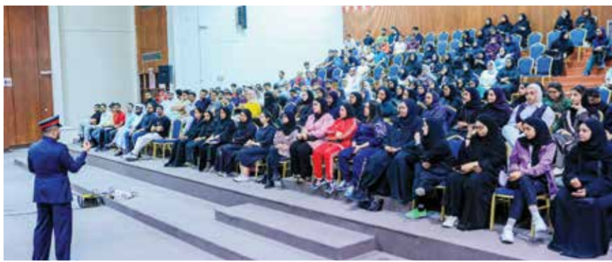
○ جانب من ندوة أساسيات مكافحة الحريق والسلامة العامة.

الطوارئ، وقد أكد المتطوعون أن المعلومات التي حصلوا عليها ستساعدتهم في التعامل مع حالات الطوارئ بشكل أفضل. ونجحت الندوة في تحقيق أهدافها بتزويد المتطوعين بمعرفة أساسية حول مكافحة الحريق والسلامة العامة، مما يعكس استعدادهم الكبير لتطبيق هذه المعرفة في الدورة بصورة خاصة وحياتهم اليومية وأعمالهم التطوعية.