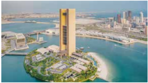
كتبت: نوال عباس

فتح مجلس المناقصات والمزايدات، الجهة التنظيمية المستقلة المكلفة بالإشراف على ممارسات المناقصات والمزايدات الحكومية، أمس مظاريف ١٠ مناقصات مطروحة من جهات متصرفة، وتنافس ٣ شركات على مناقصة طرحتها هيئة البحرين للسياحة والمعارض لتطوير شاطئ عام وبناء ناد شاطئي بمشروع شاطئ خليج البحرين، وتتطلع هيئة البحرين للسياحة والمعارض إلى تعيين شركة متخصصة في مجال الإنشاءات لتطوير شاطئ عام وبناء ناد شاطئي بمشروع شاطئ خليج البحرين وفقاً لوثائق المناقصة. ويعد مشروع شاطئ خليج البحرين أحد المشاريع ضمن الاستراتيجية السياحية للفترة من ٢٠٢٢ إلى ٢٠٢٦، التي تهدف إلى تطوير البنية التحتية السياحية بهدف جذب المزيد من الزوار والسياح إلى المملكة وتبلغ مساحة المشروع ١٧٣٠٠٠ متر وهو عبارة عن ٥ قسائم تتضمن شاطئ عام وقسمة سيتم تطويرها من قبل الهيئة و٣ قسائم مؤجرة للبنك الأهلي المتحد مع لفرش التطوير من قبل القطاع الخاص.