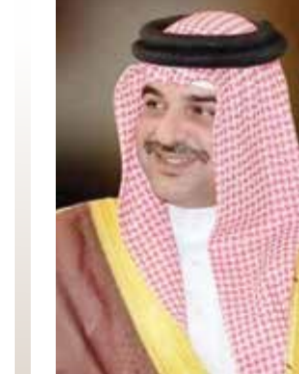
○ سمو الشيخ عبدالله بن حمد.

أكد سمو الشيخ عيسى بن سلمان بن حمد آل خليفة رئيس مجلس أمناء وقف عيسى بن سلمان التعليمي الخيري رئيس مجلس إدارة صندوق العمل أن مملكة البحرين تمضي قدما في تنفيذ الخطط وتبني المبادرات والبرامج الرامية إلى خلق الفرص الواعدة لأبناء الوطن ودعم تطورهما شريكا بارزا ضمن مسيرة المنجزات الوطنية، وعماد المستقبل المشرق الذي نعمل عليه لمواصلة تحقيق المزيد من النجاحات والإنجازات.