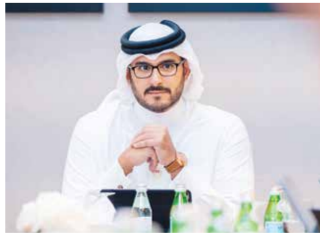
○ سمو الشيخ عيسى بن سلمان يترأس اجتماع مجلس إدارة «تمكين».

في نوفمبر من العام الماضي أكثر من ٣٢ ألف بحريني، ليكون بذلك الأداء الأعلى للصندوق منذ التأسيس، كما أنّ ٤٧٪ من إجمالي البحرينيين في القطاع الخاص مستفيدون قائمون من برامج دعم الأجور وزيادتها.