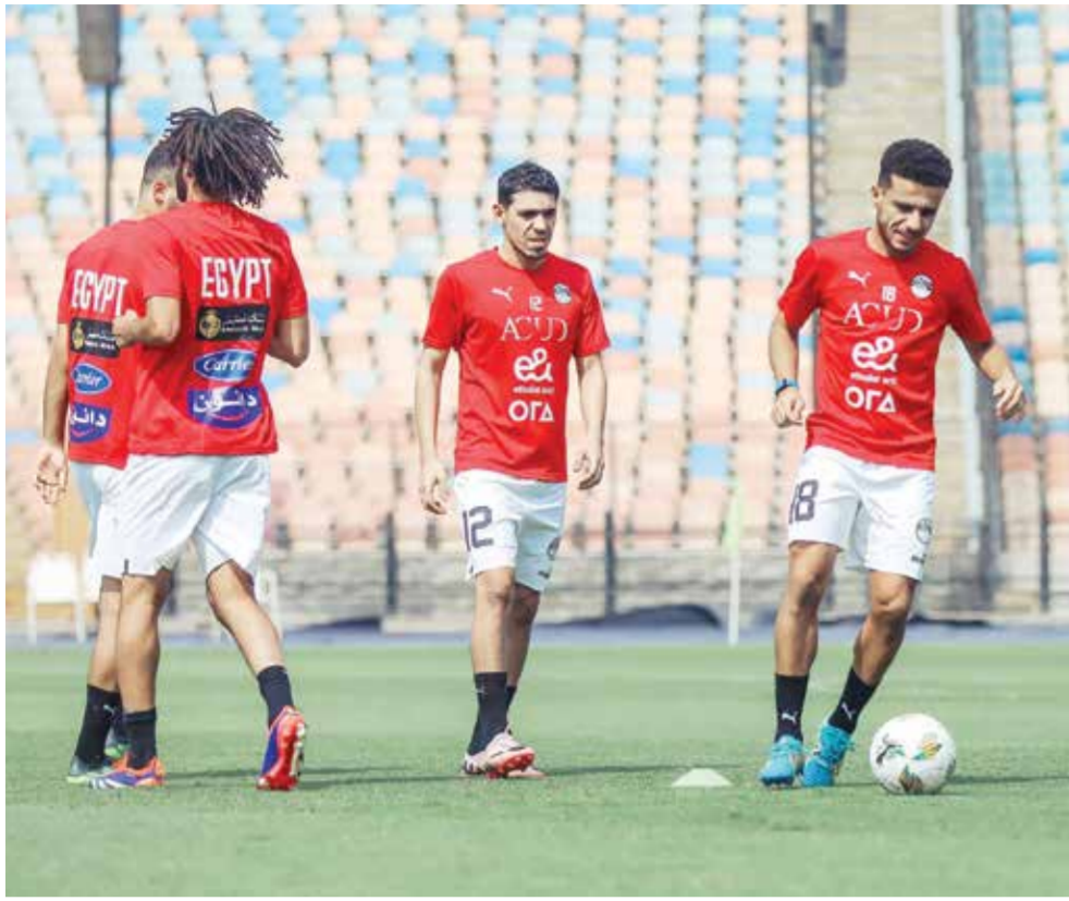
○ تدريبات المنتخب المصري