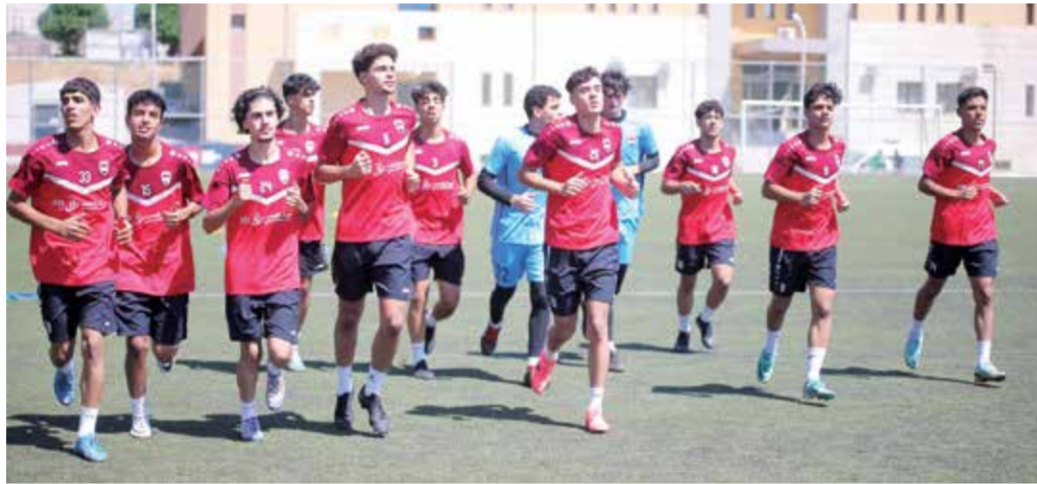
○ من تدريبات منتخب الناشئين.

يذكر أن المنتخب الجزائري يتصدر المجموعة الخامسة بعد فوزه على ضيفه غينيا الاستوائية ٢/٠ صفر، مستفيدا من تعادل توجو وليبيريا ١/١.