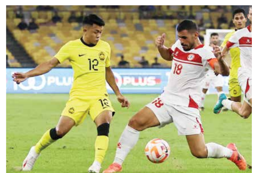
○ من لقاء لبنان وماليزيا

مهدي خليل في التعامل معها (٣٣). وكان المنتخب اللبناني قد بلغ المباراة النهائية إثر تغلبه على نظيره الطاجيكي ١-٠، فيما فاز الماليزي على الفلبيني ٢-١. وتستعد المنتخبات الأربعة لاستكمال التصفيات المؤهلة لنهائيات كأس آسيا ٢٠٢٧، والتي تنطلق في مارس المقبل وستكون الوقفة الدولية المقبلة لفريق المدرب المونتينيغري ميودراغ رادولوفيتش في فيتنام، حيث سيشترك في دورة ودية ثلاثية ستجمعه مع منتخب الدولة المضيفة والهند بين ١٠ و١٦ أكتوبر.