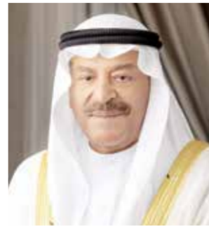
○ رئيس مجلس الشورى.

كما أشاد علي بن صالح الصالح رئيس مجلس الشورى بصور المرسوم الملكي السامي عن حضرة صاحب الجلالة الملك حمد بن عيسى آل خليفة ملك البلاد المعظم القائد الأعلى للقوات المسلحة بالعضو عن المحكومين، وذلك بالتزامن مع الاحتفال باليوبيل الفضي لتولي جلالته مقاليد الحكم. وأكد رئيس مجلس الشورى أن المبادرات الحكومية التي تسهم في إبراز قيم ومبادئ حقوق الإنسان التي تتمسك بها مملكة البحرين، وذلك باعتباره جزءاً من الثوابت الوطنية الراسخة. وقال رئيس مجلس الشورى إن مملكة البحرين تقدم نموذجاً حضارياً في تطبيق أفضل الممارسات والمعايير في مجال حقوق الإنسان، ومن خلال التعاون المثمر بين المؤسسات والمنظمات الحقوقية التي تزخر بها مملكة البحرين، مشيداً ببرامج السجون المفتوحة، وبرامج العقوبات البديلة، إلى جانب البرامج التأهيلية والتدريبية التي تقدم للمحكومين، بما يسهم في إدماجهم بالمجتمع، وتحفيزهم على المشاركة في بناء الوطن، والنهوض بمسيرة التنمية والأرزهار.