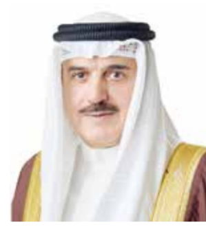
○ رئيس مجلس النواب.

المجتمع. وأشاد بالحرص على تنفيذ المشاريع والمبادرات والبرامج التأهيلية التي تهدف إلى تعزيز النهج البناء وإدماج المستفيدين في المجتمع وترسيخ تماسك المجتمع. وأضاف أن مملكة البحرين، في ظل رعاية جلالته الملك المعظم والتوجيهات السامية، جسدت أسمى معاني الإنسانية والحرص على لم شمل الأسرة البحرينية للمعفي عنهم، ما ترك أثراً بالغاً نتيجة العفو الملكي السامي. ويأتي هذا العفو تجسيداً للقيم الإنسانية الرفيعة، ويسهم في تنمية روح الانتماء الوطني، وترسيخ الأمن الواحد، وحماية النسيج الاجتماعي، وإتاحة الفرصة للمحكوم عليهم للاندماج الإيجابي في المجتمع.