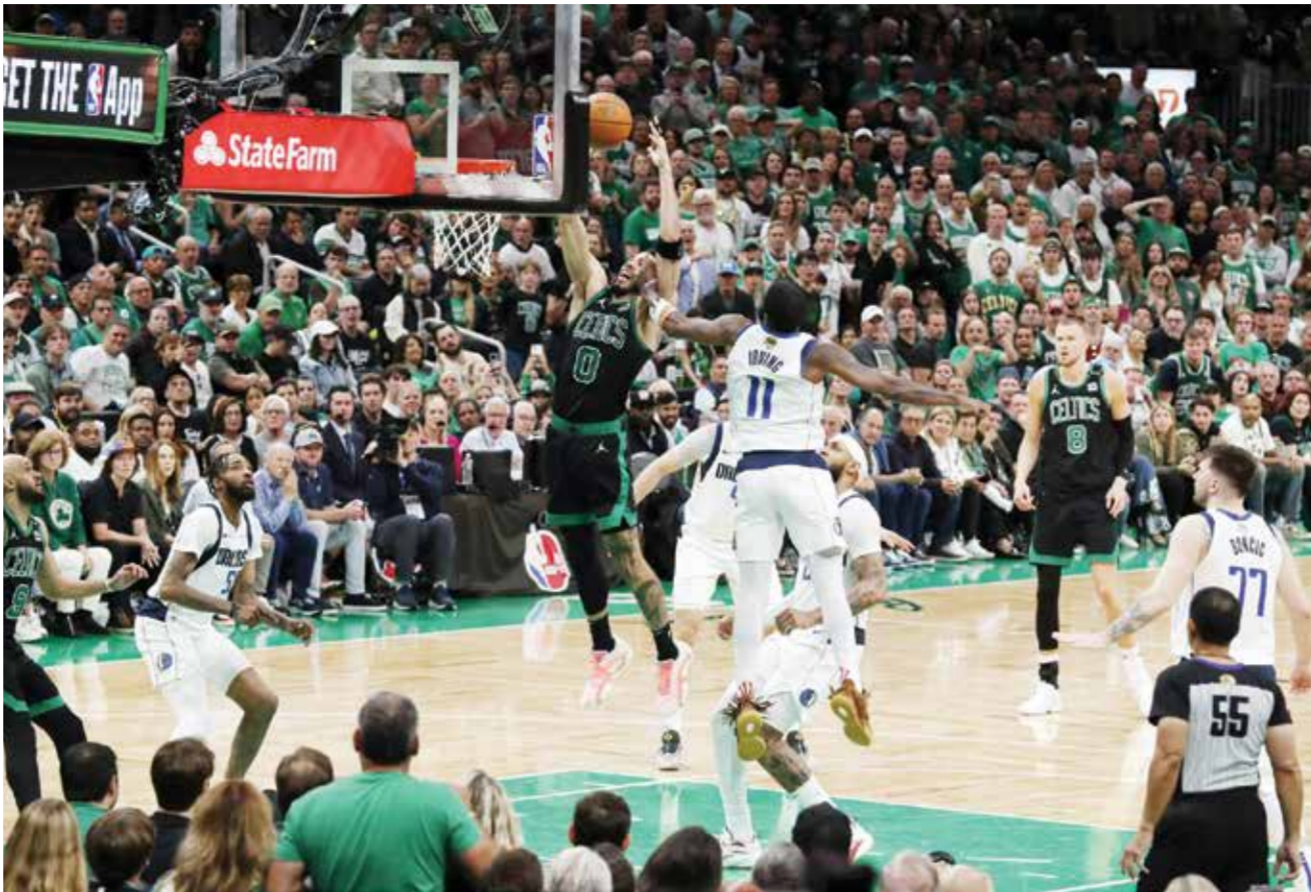
○ سلتيكس يتأق

نيويورك - (أ ف ب): أصيبت العداءة الجامايكية ايلين تومسون-هيراه، حاملة خمس ذهبيات أولمبية، الأحد خلال سباق ١٠٠ م في جائزة نيويورك الكبرى للألعاب القوى واحتجاجت إلى المساعدة من قبل طاقم فريقها للخروج بعد وصولها إلى خط النهاية. وأنت نجمه سباقات السرعة، البالغة ٣١ عاماً، سباق ١٠٠ م في المركز الأخير بتوقيت بلغ ١١,٤٨ ثانية بشكل بعيد عن أرقامها الممهودة قبل أقل من شهرين من انطلاق دورة الألعاب الأولمبية في باريس. وتقام تجارب اختيار المنتخب الجامايكي الأولمبي في نهاية الشهر الحالي. وتعد تومسون-هيراه ثاني أسرع عداءة في التاريخ في سباق ١٠٠ م، بعد تسجيلاها ١٠,٥٤ ثوان في بوجين الأمريكية عام ٢٠٢١ م. وحدها الأمريكية الراحلة فلورنث غريفث-جونور أسرع منها (١٠,٤٩ ث). وتلقت تومسون-هيراه المساعدة من فريقها فور نهاية السباق للخروج من الحلبة نحو المنطقة المختلطة حيث لم تدل بأي تصريح. وسيطرت تومسون-هيراه على سباقها السرعة في العقد الأخير، فأحرزت ثنائية ١٠٠ م في أولمبياد ريو ٢٠١٦ ثم احتفظت باللقب في طوكيو صيف ٢٠٢١، كما نالت ذهبية التتابع ١٠٠ م في طوكيو.