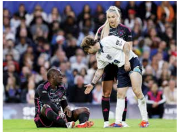
○ بولت يتلقى المساعدة

نيويورك - (أ ف ب): استغل بوسطن سلتيكس عامل الأرض على أكمل وجه وتقدم في سلسلة نهائي دوري كرة السلة الأمريكي للمحترفين على دالاس مافريكس ٢-٠، وذلك بالفوز عليه ٩٨-١٠٥ الأحد على ملعب «تي دي غاردن». ولم تكن المباراة الثانية من أصل سبع ممكنة في هذه السلسلة سهلة بقدر الأولى التي حقق فيها سلتيكس فوزاً كبيراً الخميس ١٠٧-٨٩. ورغم جهود السلوفيني لوكا دونتشيتش الذي بات أول لاعب في تاريخ مافريكس يحقق ثلاثة أرقام مزدوجة «تربيل دابل» في النهائي بتسجيله ٣٢ نقطة مع ١١ متابعة و١١ تمريرة حاسمة، أكد الفريق الأخضر الأسطوري مجدداً أنه المرشح الأوفر حظاً وأنه لم يأت من فراغ تصدره المنطقة الشرقية والترتيب العام خلال الموسم المنتظم ثم تألقه في البرلاي أوف، بالفوز على ميامي هيت ١-٤ ومن بعده على كليفلاند كافالييرز ١-٤ أيضاً قبل أن يقتنع إنديانا بايسرز في نهائي المنطقة ٤-٠. وهذا ما أقر به دونتشيتش نفسه بالقول عن الفريق الباحث عن لقبه