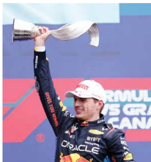
○ فيرستابن بطل كندا (أ ف ب)

مونتريال - (أ ف ب): أحرز سائق ريد بول الهولندي ماكس فيرستابن، بطل العالم في الأعوام الثلاثة الأخيرة، الأحد المركز الأول في سباق جائزة كندا الكبرى، المرحلة التاسعة من بطولة العالم للفورمولا واحد، على حلبة جيل فيلنوف في مونتريال، وذلك للعام الثالث تواليًّا. وقطع فيرستابن الذي انطلق من المركز الثاني واستعاد نعمة الانتصارات بعد حلوله سادساً في جائزة موناكو الكبرى في المرحلة الثامنة، مسافة السباق بزمن ١,٤٥:٤٧,٩٢٢ ساعة متقدماً على البريطانيين لاندو نوريس (ماكلازين) بفارق ٣,٨٧٩ ثوان وجورج راسل بفارق ٤,٣١٧ ثوان ولويس هاميلتون (مرسيدس) بفارق ٤,٩١٥ ثوان. وقال فيرستابن: «لقد كان سباقاً مجنوناً إلى حد ما، حدثت أشياء كثيرة. لقد خضنا سباقاً رائعاً، وعمل الفريق بشكل جيد جداً». وأضاف: «دخلنا إلى المراب في الوقت المناسب وسيارة الأمان خرجت في اللحظة المناسبة بالنسبة لنا». وتابع: «لقد استمتعت كثيراً. لا يزال لدينا مجال كبير للتحسن، لكن الشيء الأكثر أهمية هو الفوز». وكرر فيرستابن إنجازة في إيميليا رومانيا عندما حقق الفوز الثالث تواليًّا له في السباق الإيطالي، وعادل إنجاز البرازيلي نيلسون بيكييت في مونتريال ويات على بعد ٤ انتصارات من صاحبي الرقم القياسي على الحلبة الكندية الألماني ميكائيل شوماخر والبريطاني لويس هاميلتون.