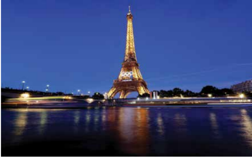
○ الاستعدادات مستمرة (رويترز)

باريس - (رويترز) : قال توماس باخ رئيس اللجنة الأولمبية الدولية واللجنة المنظمة لأولمبياد باريس ٢٠٢٤ أمس الاثنين إن الاضطرابات السياسية في فرنسا لن تؤثر على الاستعداد للألعاب الأولمبية بعد أن فاجأ الرئيس إيمانويل ماكرون الجميع بدعوته لإجراء انتخابات برلمانية مبكرة. وقال باخ خلال فعاليات في العاصمة الفرنسية للاستعداد لأولمبياد باريس ٢٠٢٤ «فرنسا معتادة على إجراء الانتخابات، وستفعل ذلك مرة أخرى. ستكون هناك حكومة جديدة والجميع سيساند الألعاب الأولمبية». وأضاف أنه مهما كانت النتيجة، فإن القادة السياسيين سيدعمون الألعاب الأولمبية. وقال رئيس اللجنة الأولمبية الدولية «ليس لدي ما يشير على الإطلاق إلى تفكك هذه الوحدة الآن أو قبل يومين فقط من افتتاح الأولمبياد». ومع ذلك، اتخذت أن إيدالجو رئيسة بلدية باريس، العضو في الحزب الاشتراكي، لهجة أكثر انتقاداً. وقالت إيدالجو إنها «واجهت أوقاتاً صعبة لفهم، لماذا اختار ساكرون دفع البلاد إلى حالة من عدم اليقين السياسي مع اقتراب انطلاق الألعاب الأولمبية، ووصفت هذه الخطوة بأنها «ضربة أخرى» من الرئيس. وقال توني استانجيه رئيس اللجنة المنظمة لأولمبياد إن فريقه «أكثر تصميمًا وعزمًا من ذي