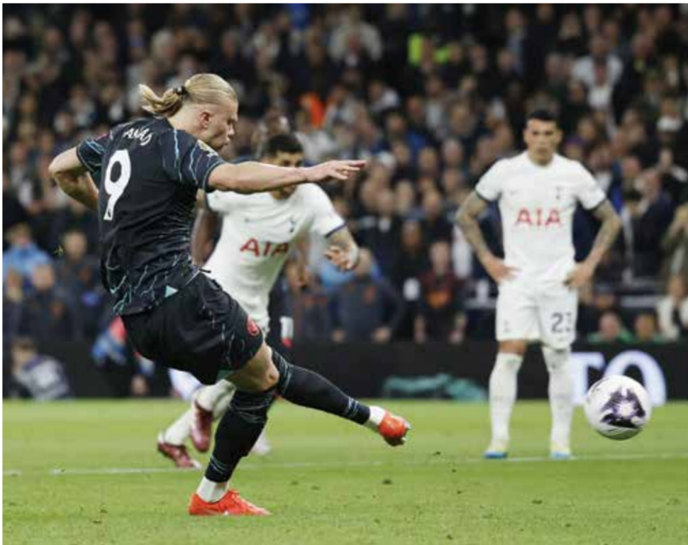
○ من لقاء مانشستر سيتي وتوتنهام

وتابع سيتي ضغطه بعد تمريرة من فيل فودن إلى كايل ووكر الذي تقدم مستغلا المساحات نحو