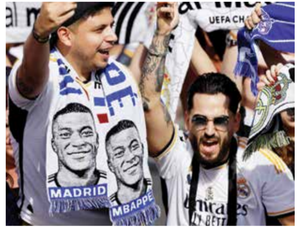
○ مشجعو الريال ينتظرون مبابي

وقال إن مسيرته المقبلة ستكون مثيرة للغاية لكنه لم يكشف عن أي تفاصيل أخرى. وأضاف مبابي «الآن أطوي صفحة في حياتي. كل ما يأتي بعد ذلك سيكون مثيرا للغاية، لكن هذا موضوع آخر. شكرا لكم جميعا سأفتكدم. لقد حاولت دائما أن أبذل قصارى جهدي، وأريد أيضا أن أشكر عائلتي التي كانت معي دائما في الأوقات الجيدة والسليمة. والذي الموجود هنا، أعلم أنه كان من المهم جدا بالنسبة له أن أصنع التاريخ في الدوري الفرنسي قبل مغادرتي وأعتقد أنني بتواضع فعلت كل ما أدرته».