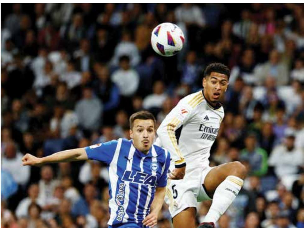
○ من لقاء ريال مدريد والأفيس

وفي مباراة ثانية تعادل اوساسونا مع مايوركا ١-١. ويلتقي لاحقا جيرونا مع فياريال.