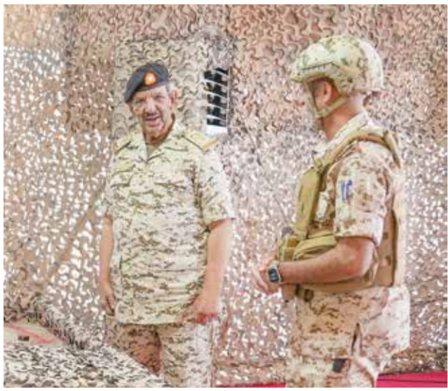
القائد العام خلال تفقده تمرين «درع الوطن» ٢٠٢٤.

أكد صاحب السمو الملكي الأمير سلمان بن حمد آل خليفة ولي العهد رئيس مجلس الوزراء أن استضافة مملكة البحرين اجتماع مجلس جامعة الدول العربية على مستوى القمة في دورته الثالثة والثلاثين تأتي تجسيدا لالتزام مملكة البحرين الدائم تجاه تعزيز منظومة العمل العربي المشترك نحو مزيد من التكامل تحقيقاً للرؤى الملكية السامية