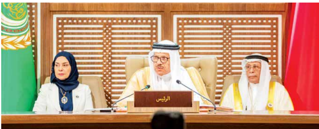
وزير الخارجية يتراس الاجتماع الوزاري العربي.