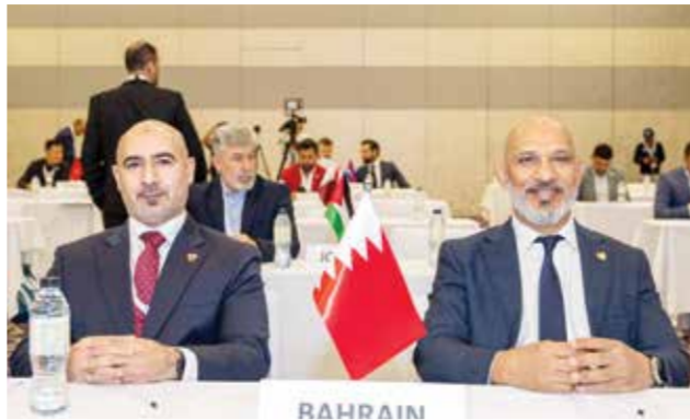
○ منفردى وجناحي خلال مشاركتهما

كشفت الاتحاد البحريني لكامل الأجسام واللياقة البدنية عن فئات بطولة سمو الشيخ خالد بن حمد آل خليفة المفتوحة لبناء الأجسام والتي ستقام تحت رعاية سمو الشيخ خالد بن حمد آل خليفة النائب الأول لرئيس المجلس الأعلى للشباب والرياضة رئيس اللجنة الأولمبية البحرينية وذلك في ٢٣ من شهر أغسطس ٢٠٢٤ بقاعة الشيخ عبدالعزيز بن محمد آل خليفة بجامعة البحرين. وستضم البطولة ١٧ فئة في مسابقاتها، والفئات هي: كمال الأجسام وزن ٧٠ كيلوغرام، كمال الأجسام وزن ٨٠ كيلوغراما، كمال الأجسام وزن ٩٠ كيلوغراما، كمال الأجسام وزن فوق ٩٠ كيلوغراما، جونيور كمال الأجسام (فئة واحدة) من ١٦ حتى ٢٣ سنة، ماستر كمال الأجسام (فئة واحدة) ٤٠ سنة فما فوق، ماستر فيزيك (فئة واحدة) ٤٠ سنة فما فوق،