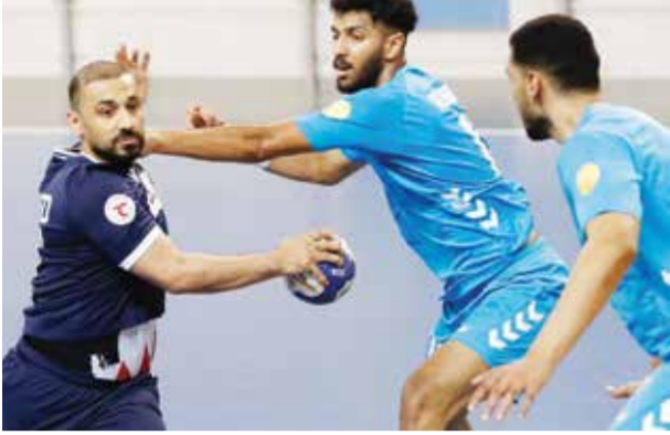
○ من لقاء النجمة والشباب.

كتب: أحمد توفيق استعاد النجمة وصافة الترتيب العام لدوري خالد بن حمد لكرة اليد بعد تفوقه على منافسه المتصدر فريق الشباب بنتيجة (٢٧/٣٢)، في المباراة التي جمعتهم أمس الأحد على صالة اتحاد اللعبة بأم الحصم، ضمن الجولة الأخيرة من الدور التمهيدي للمسابقة.