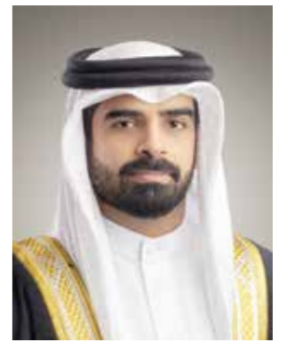
○ سمو الشيخ سلمان بن محمد آل خليفة