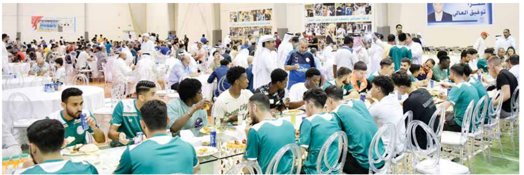
○ لقطة من الحفل.

ثقة الاتحادات بالكفاءة العالية للكوادر البحرينية وبهذه المناسبة، هنأ سمو الشيخ سلمان بن محمد آل خليفة نائب رئيس الهيئة العامة للرياضة رئيس المجلس البحريني للألعاب القتالية، رئيس الاتحاد البحريني للجوجيتسو رضا إبراهيم منفردى بفوزه بمنصب النائب الأول لرئيس الاتحاد الآسيوي