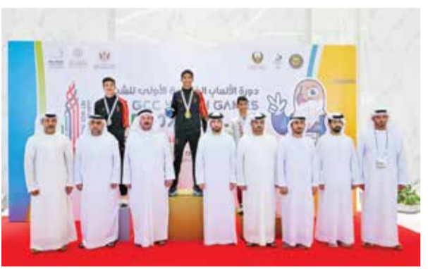
○ تكريم أبطال البحرين.

كتب: أحمد توفيق استعاد النجمة وصافة الترتيب العام لدوري خالد بن حمد لكرة اليد بعد تفوقه على منافسه المتصدر فريق الشباب بنتيجة (٢٧/٣٢)، في المباراة التي جمعتهم أمس الأحد على صالة اتحاد اللعبة بأم الحصم، ضمن الجولة الأخيرة من الدور التمهيدي للمسابقة.